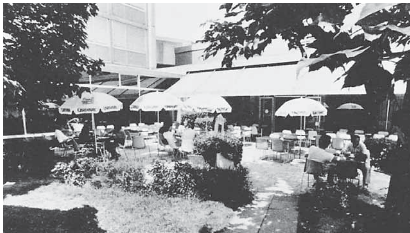
Restaurant de la Cité Universitaire