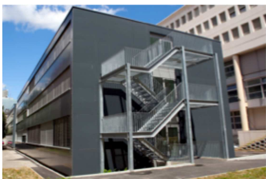
§Vue du Pavillon Mail