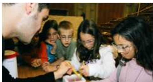
Un étudiant enseignant

Le MEES est là pour tous les étudiants de la FORENSEC, n'hésitez pas à prendre contact avec nous par e-mail pour toute question, problème ou proposition.