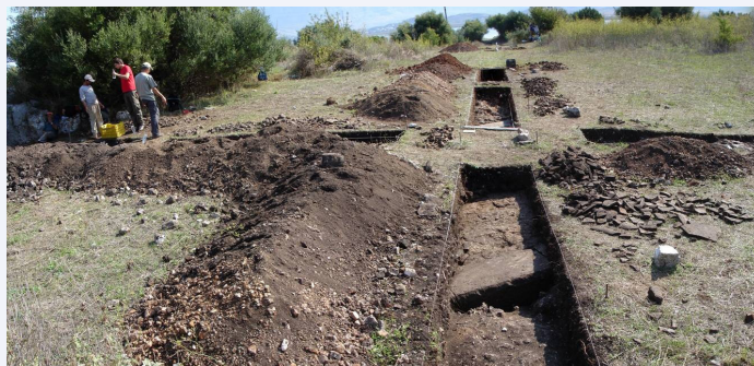
Fouilles d'Orikos (Albanie)