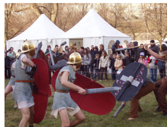
Démonstration de l'association GENVA à l'occasion du 450e anniversaire de UNIGE (2009)