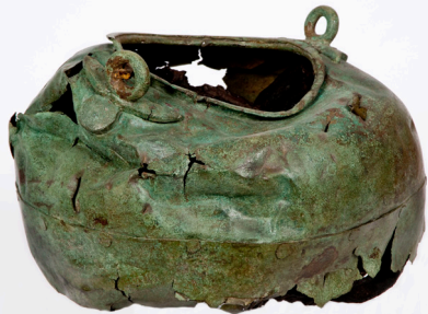
Chaudron de Crotona [projet d'exposition]