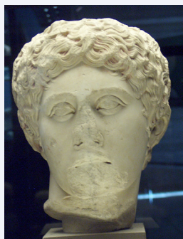
Tête en marbre d'Uthina [projet de publication]

D'autres projets de recherche et de publication sont actuellement en préparation.