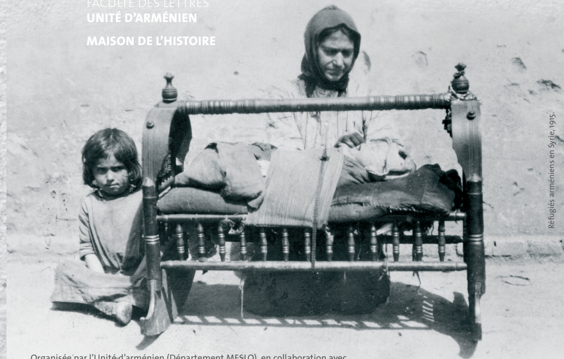
Réfugiés arméniens en Syrie, 1915.

FACULTÉ DES LETTRES UNITÉ D'ARMÉNIEN MAISON DE L'HISTOIRE