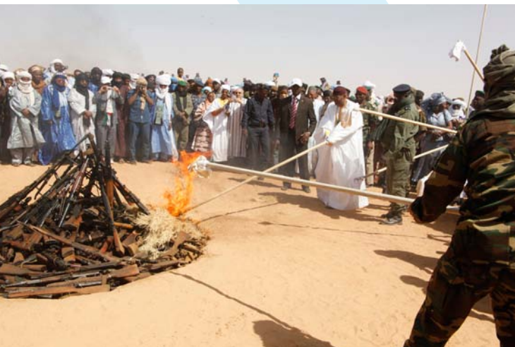
Mali (09.02.2011).