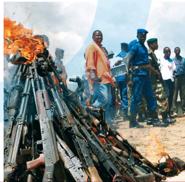
Burundi (02.12.2004).