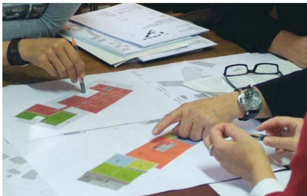
Placé sous le signe de la concertation, le projet conduit par l'IMSP a donné lieu à de nombreuses réunions.

Les premiers contacts entre Meinier et l'IMSP remontent à 1991, époque à laquelle les chercheurs de l'Université conduisent une première enquête destinée à mettre en évidence les besoins des habitants en matière de santé au sens large. Manque de lien social, problème d'intégration pour les jeunes, difficultés socio-économiques pour les personnes