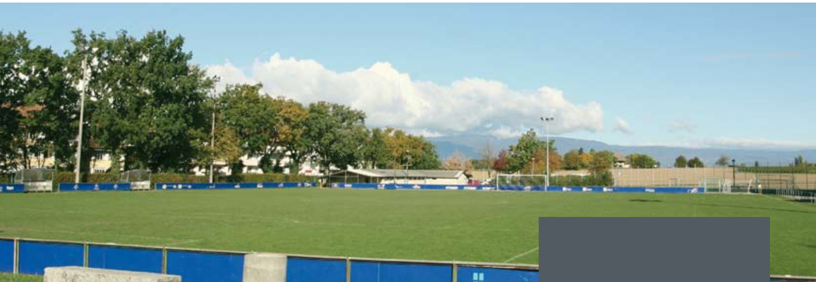
C'est sur l'emplacement actuel du terrain de foot communal que se dressera le lieu de vie intergénérationnel.

aux habitants des différentes générations de disposer d'un lieu de rencontre et d'échange. Il s'agit également de répondre aux attentes des personnes âgées souhaitant rester dans la commune et d'améliorer les possibilités de mobilité, que ce soit en direction de l'agglomération et du territoire communal.