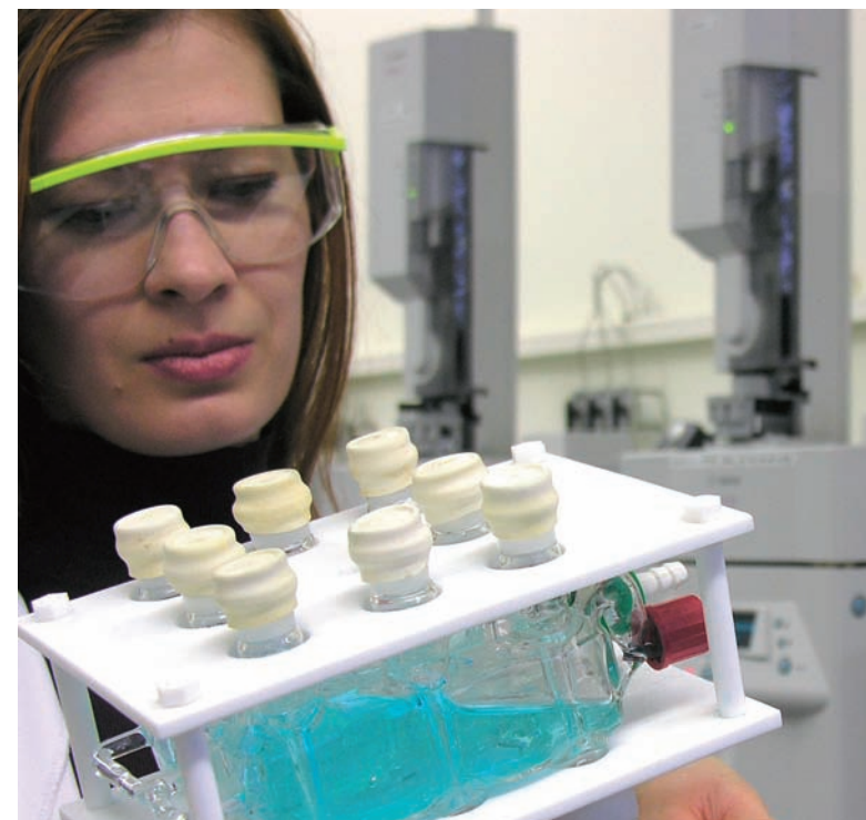
UNIGE / Presse information publications / 7 e Edition, septembre 2007

Les chimistes créent et découvrent! Leur art est à l'avant-garde des avancées de la société moderne.