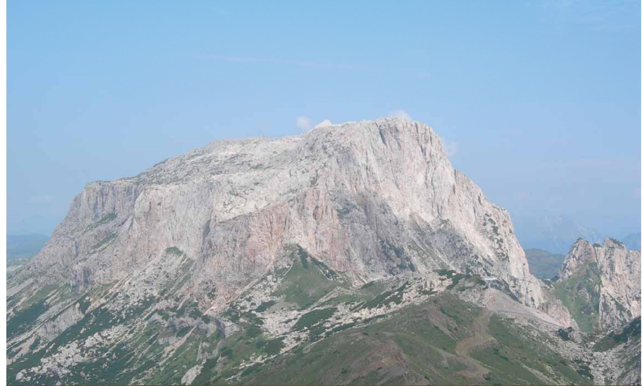
Alpes Carniques, Autriche.