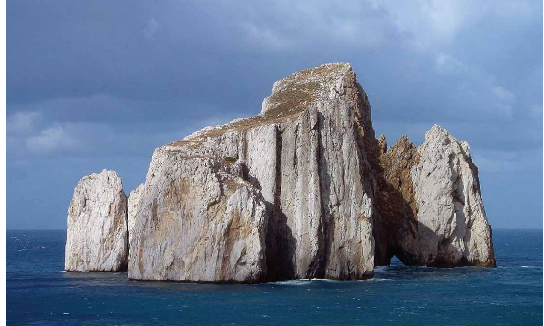
Pain de Sucre, Sardaigne.