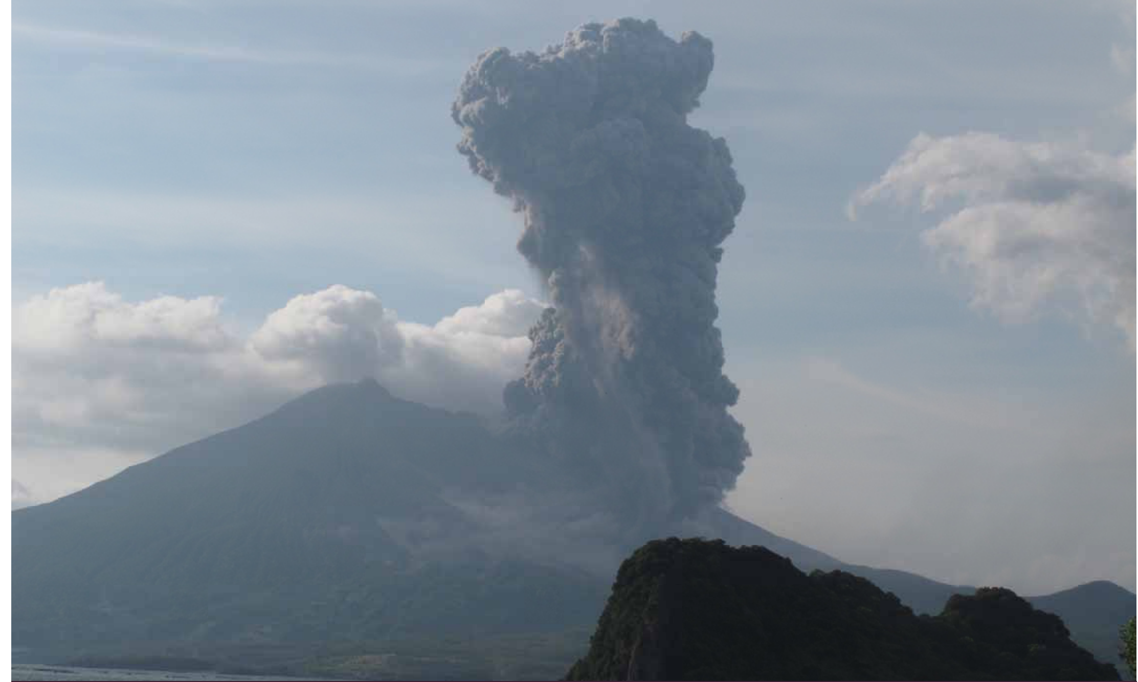
Volcan Sakurajima, Japon.