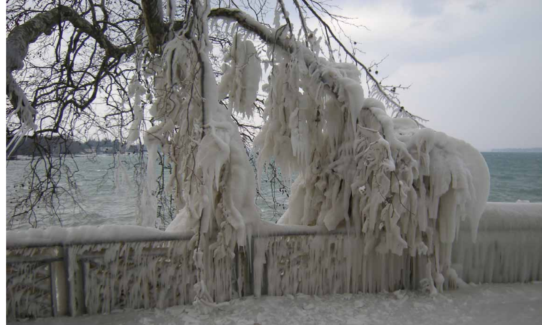
Lac Léman, Genève.