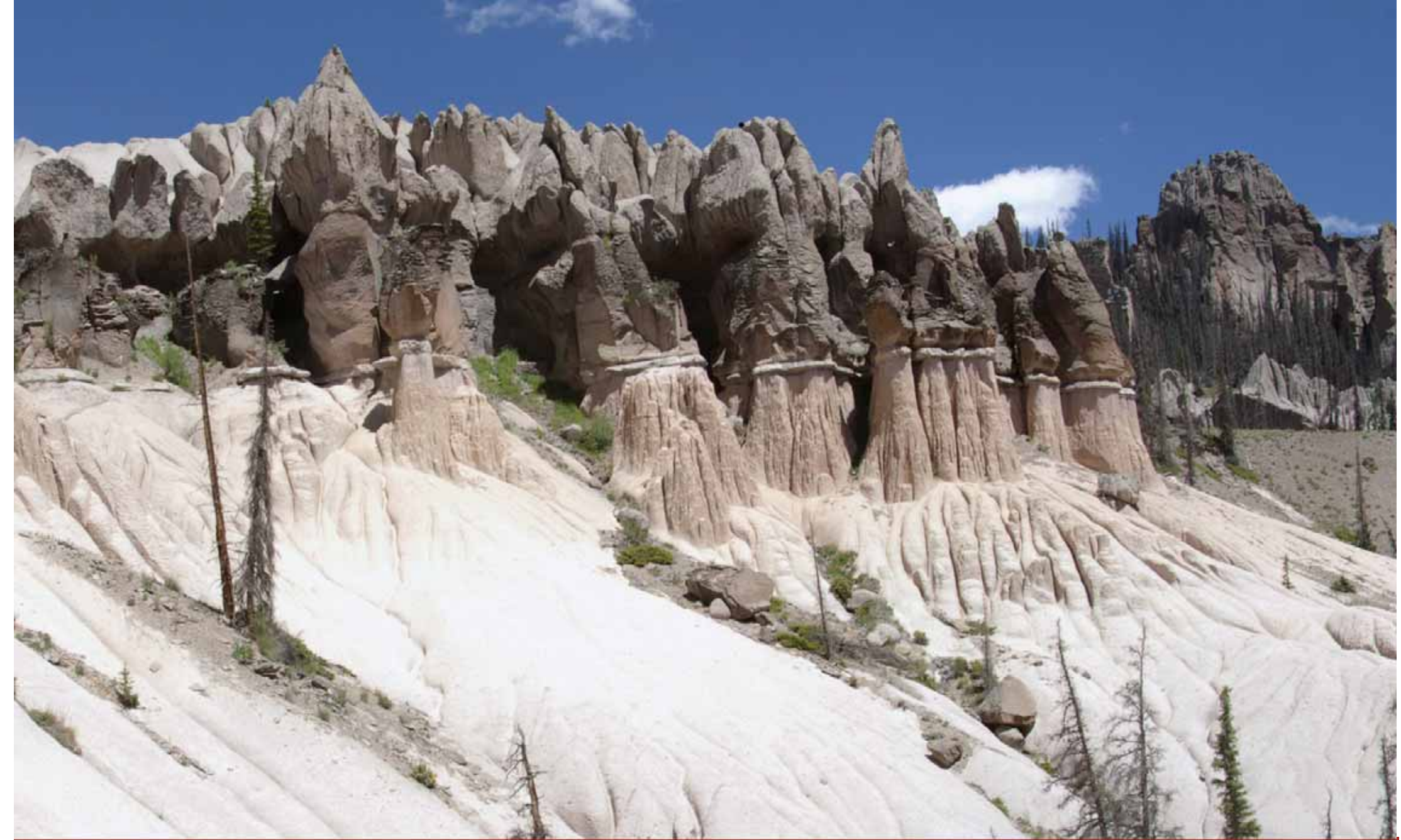
Wheeler National Monument, Colorado.