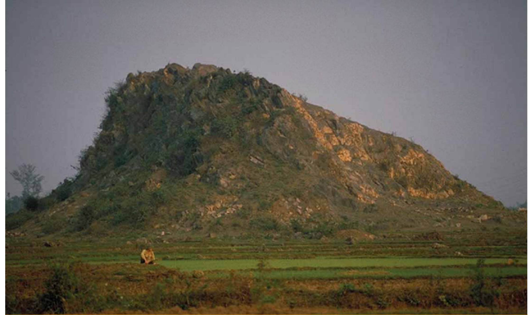
Ninh Binh, Vietnam.