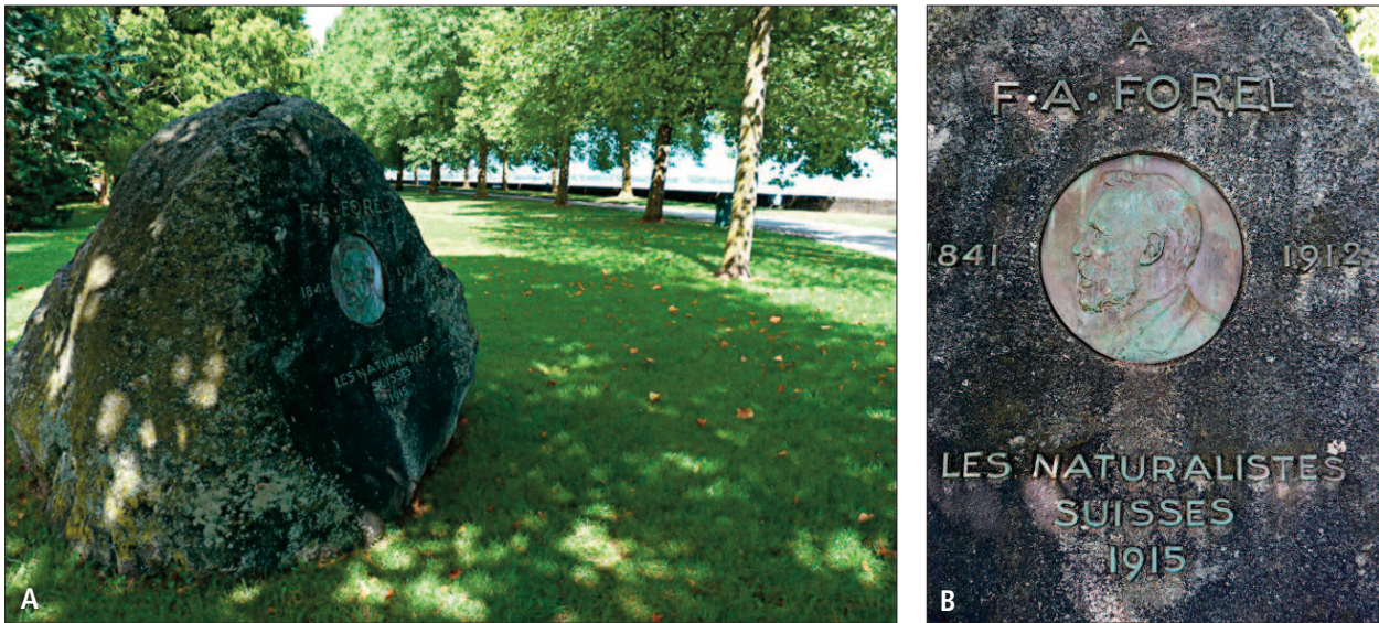
Fig. 3. (A): Le monument érigé à Morges photographié en 2012 (photographie François Forel, 2012 et (B): détail du monument (photographie François Forel, 2012).

Encouragé par son père dès son adolescence à partager sa passion pour l'archéologie, F.A. FOREL fréquente des amis de son père, membres de sociétés savantes. Il a surtout accès à de grandes collections d'objets scientifiques de diverses natures (archéologique, géologique, biologiques ou anthropologiques...). Cette initiation à la classification va être le ferment de la construction d'un esprit extraordinairement méthodique. Il est intéressant de se souvenir qu'il consacre les dernières années de sa vie à classer les collections archéologiques de divers musées, où