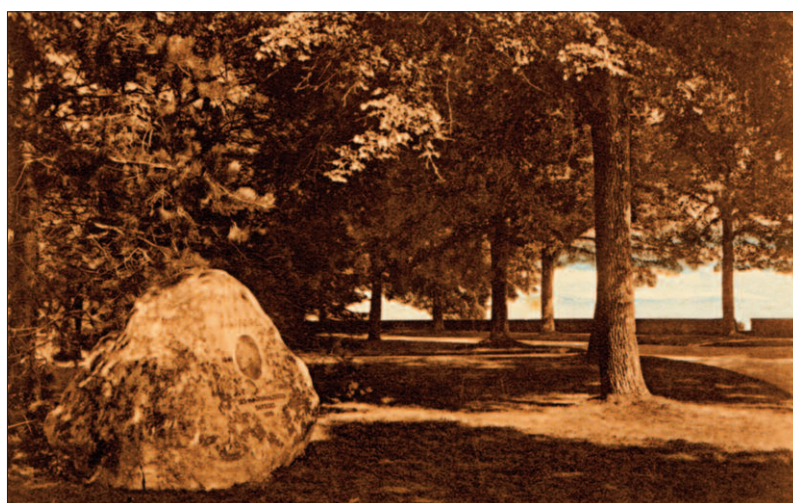
Fig. 2. Carte postale commémorative, 1915, Inauguration à Morges du monument érigé en son honneur par les naturalistes suisses, coll. Famille Forel (photographie Musée du Léman / Aurelio Moccia, dépôt Famille Forel).

lorsque celui-ci imagine cette nouvelle discipline scientifique, la limnologie. Toutefois, le cas de F.A. FOREL n'est de loin pas isolé; le limnologue français André Delbecq, auteur en 1898 de l'ouvrage de référence «Les lacs français» et qui porte aussi un grand intérêt au