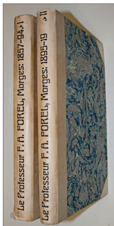
Fig. 1. « Le Professeur F.A. FOREL Morges: 1857-94, I / 1895-19, II », 2 volumes reliés de diplômes et nominations, collection famille Forel (photographie Musée du Léman / Aurelio Moccia, dépôt Famille Forel).