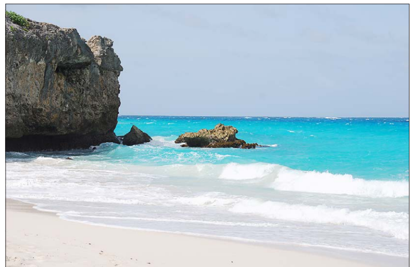
Fig. 4. Plage de Bottom Bay, île de la Barbade.