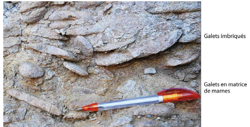
Fig. 3. Affleurement dans la Formation du Vuache. Les galets arrondis et aplatis sont parfois agencés chaotiquement (en bas de la photo), parfois imbriqués (en haut). Le stylo mesure 14 cm.

charriant du quartz et la présence de végétation indiquent que le climat était humide. La couleur rouge qui imprègne le banc calcaire depuis la couche à charbon (Fig. 2) est due à l'oxydation du fer associé à la végétation. Dans ce cas, on ne peut pas vraiment parler de plage mais plutôt d'un environnement côtier et marécageux.