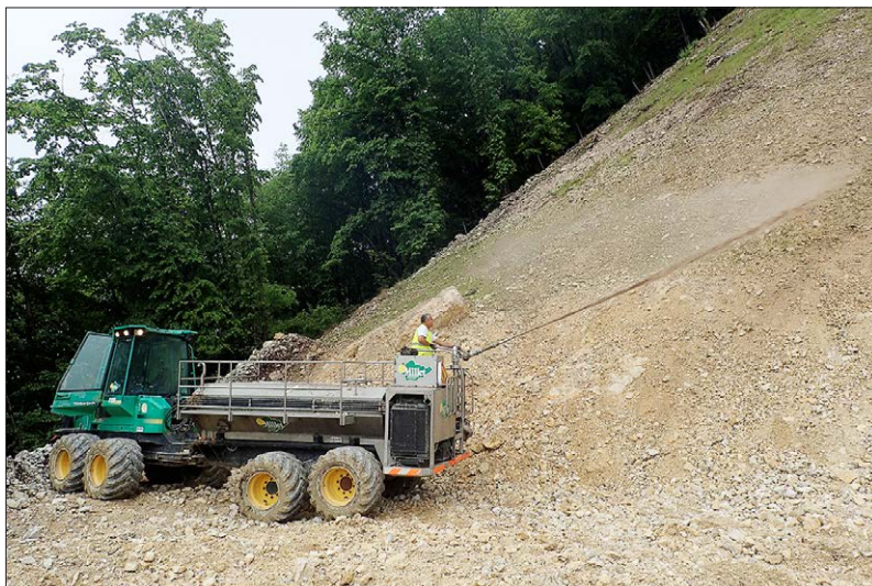
Fig. 2. Projection hydraulique du mélange grainier constitué à l'aide d'une lance à eau (04.05.2015).