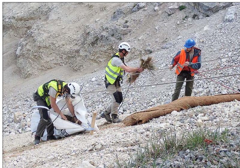
Fig. 1. Paillage d'inflorescences de stipes calamagrostides sous un géotextile fixé (30.04.2015).

De 2015 à 2017, un suivi annuel du développement de la végétation a été réalisé au sein du site d'étude (en juin 2015, décembre 2016 et juin 2017). Un quatrième