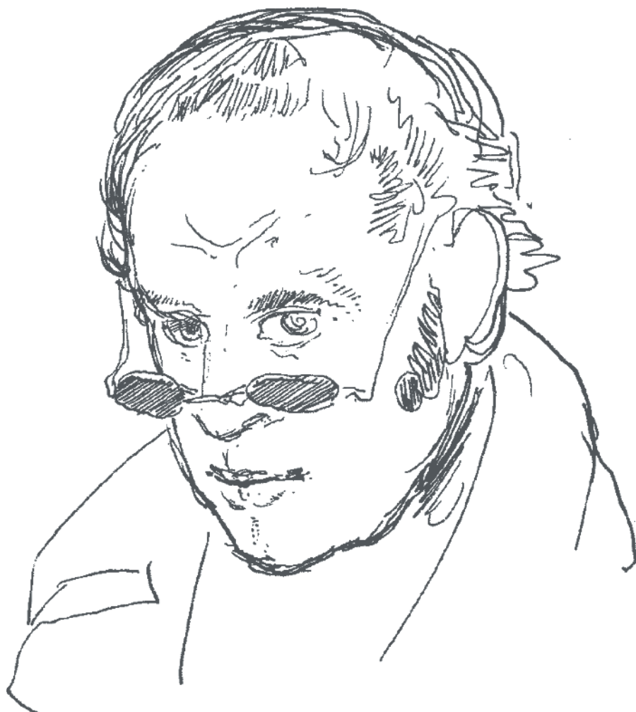
Rodolphe Töpffer, autoportrait, 1840.

ques bonnes critiques sans obtenir le succès escompté par son auteur.