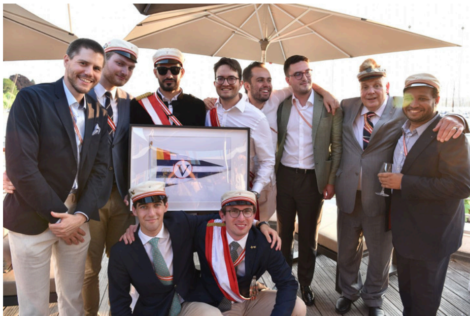
Réception du 1er juin 2023 à la Société Nautique de Genève

Zofingue est une association à vie qui cultive le principe d'hospitalité. N'hésitez pas à nous rendre visite en Stamm à la Blanche ou lors d'évènements que nous organisons, nous serons ravis de vous y voir. Une visite vaut la peine ; vous serez toujours le bienvenu.