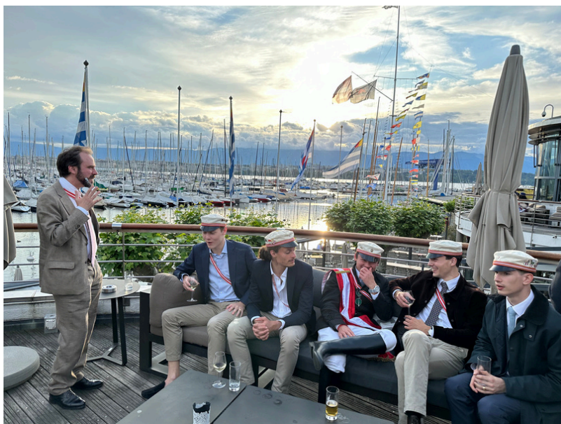
Des Zofingiens lors de l'apéro à la Nautique