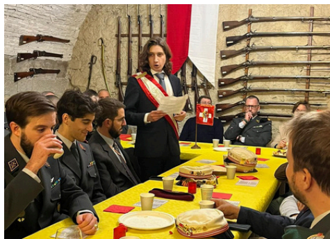
Discours du président lors de la Restauration

Enfin. Enfin les Stämme dureront plus d'une heure et demie. Enfin les brochures seront disponibles à temps. Enfin les chaises viendront à manquer. Enfin les mails recevront de vraies réponses. Enfin les conférences promises auront lieu. Enfin les gens s'amuseront. Si je pouvais tout recommencer, je ferais la même chose.