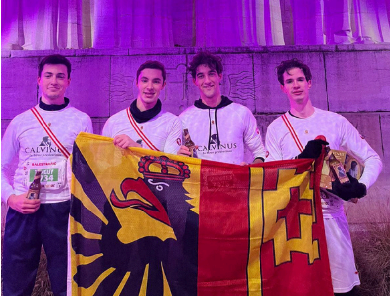
Les Zofingiens après la course du Duc