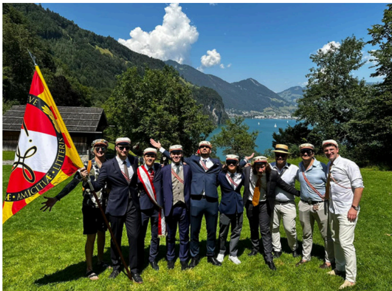
Des Zofingiens romands sur la plaine du Grütli