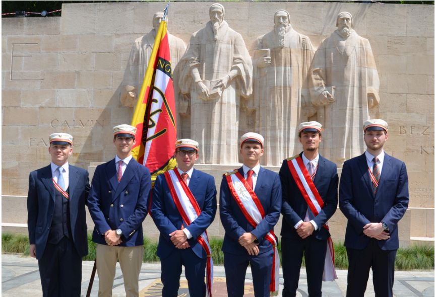
De gauche à droite : XXXX, XX, VX, X, FM, XXX