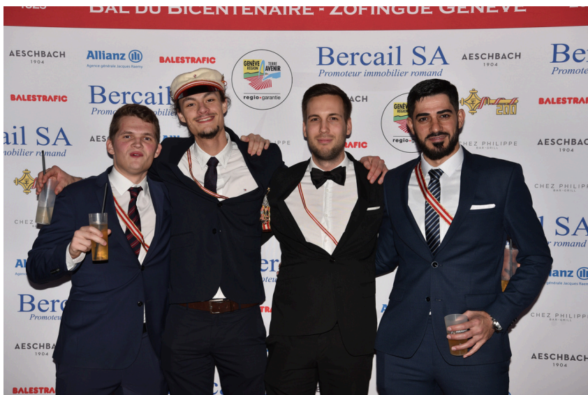
Le très éminent Doktor Cataströpflic posant avec trois admirateurs