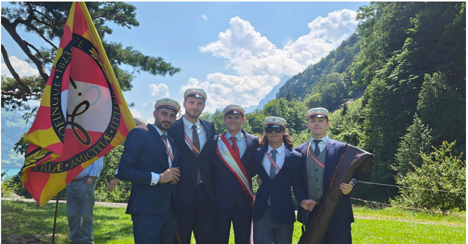
Zofingiens sur la Prairie du Grütli

Zofingue a l'honneur d'avoir pu compter parmi ses membres des personnages majeurs de notre histoire tels que le général Henri Guisan, Gustave Moynier, Charles-Ferdinand Ramuz ou encore Carl Gustav Jung. Chaque année au mois de mai, les Zofingiens de toute la Suisse se retrouvent dans la ville de Zofingen en Argovie, lors de la Fête Centrale qui dure un week-end.