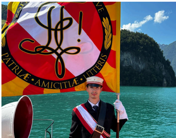
Porte-à-Puck lors de la Rütlifahrt