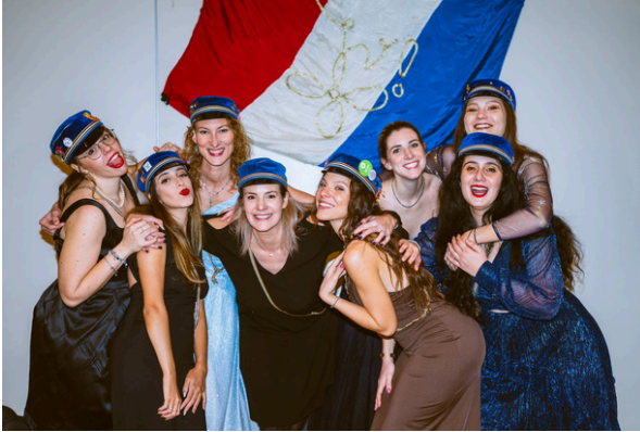
Les Vénusiennes lors du Bal Masqué de la Vénusia

N'hésite pas à nous contacter également sur : venusiagenevensis@gmail.com