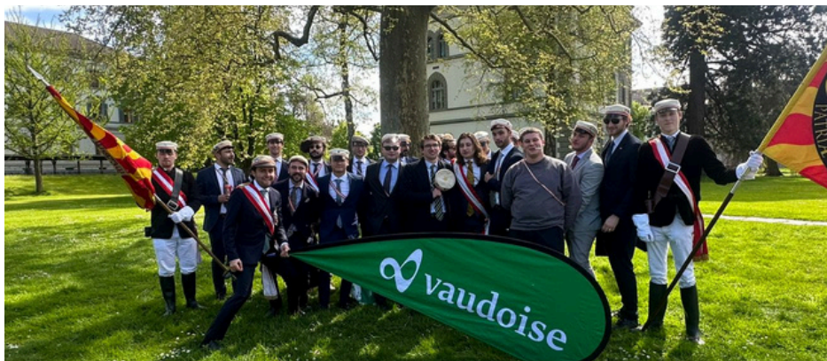
La section genevoise à la FC

En outre, la section genevoise peut se targuer d'avoir été présente en nombre tant à la fête centrale qu'à la théâtrale vaudoise ainsi que d'avoir réussi à motiver une demi-douzaine de genevois à venir jusqu'à Fribourg un mardi soir.