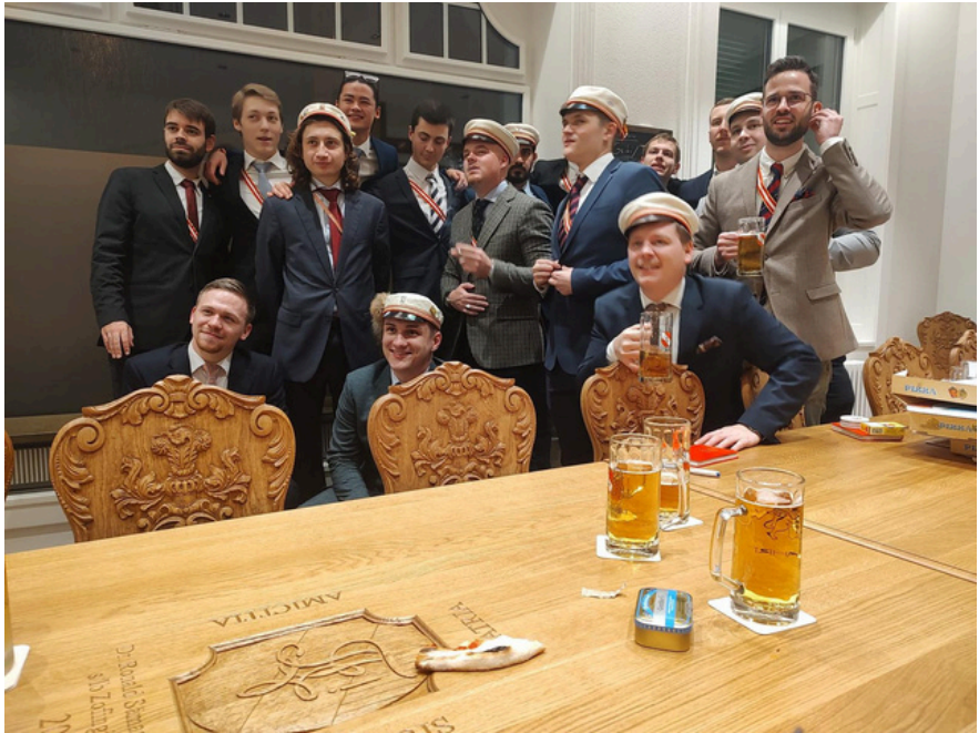
Les Zofingiens genevois en délégation à Züri

Zofingue participe à de nombreuses cérémonies patriotiques, et est à l'origine de celles du 1er juin, au Port Noir et de la Restauration le 30 décembre, sur l'esplanade de la Treille. Elle est également membre fondateur de la Compagnie de 1602.