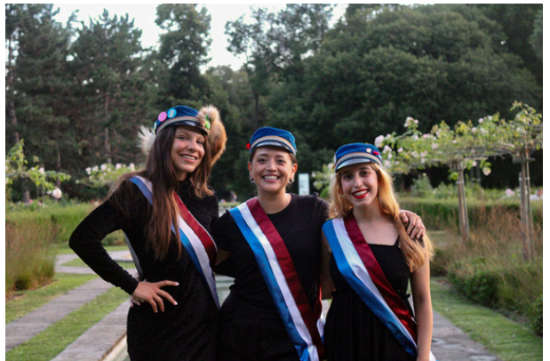
Le triumvirat SA24 de la Vénusia