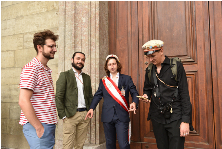
Quatre présidents, un coup de foudre

Ces organes sont le Comité Central (exécutif) d'une part, l' Assemblée des délégués et l' Assemblée de Fête (législatif) d'autre part. Cette dernière est la réunion de tous les Zofingiens de Suisse, soit l'assemblée générale de la Société.