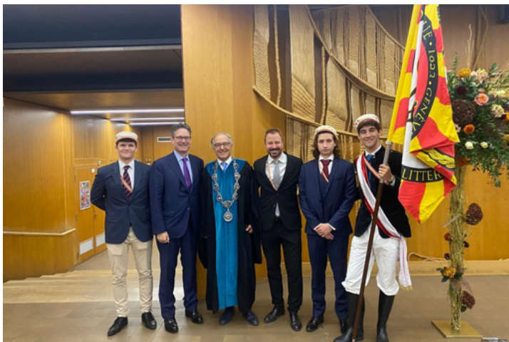
Des Zofingiens lors du Dies Academicus

Il est de notre devoir de l'entretenir afin que notre histoire et nos traditions, reliques d'époques parfois révolues ainsi que nos plus belles âneries perdurent de génération en génération et restent intactes dans le souvenir collectif.