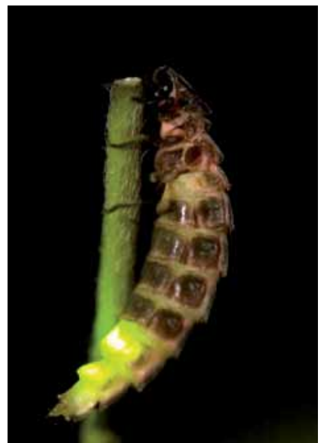
La luciole femelle (ici « Lampyris noctiluca ») produit la luciférase, une molécule qui émet de la lumière fluorescente et qui est très utilisée en biologie moléculaire.