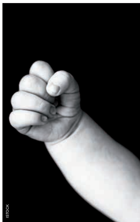
CE SONT LES MÊMES GÈNES QUI FABRIQUENT LA MAIN, LE POIGNET ET LE BRAS. TOUT DÉPEND DE QUI CONTRÔLE LEUR EXPRESSION.