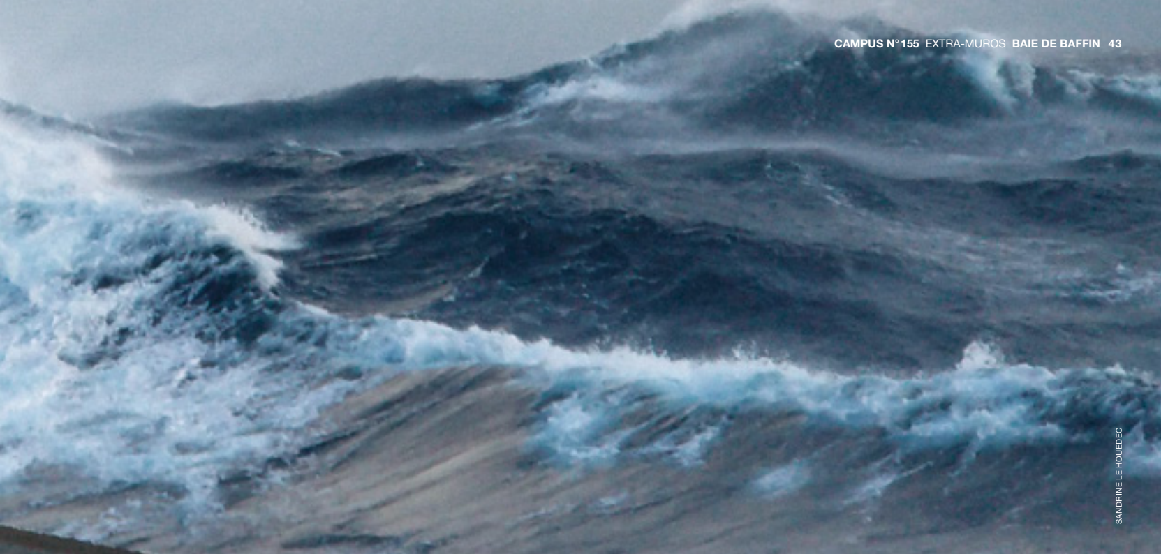
Gros temps dans la baie de Baffin, à bord du « Joïdes Resolution ».

couche jamais complètement. Et les journées seront longues, effectivement.