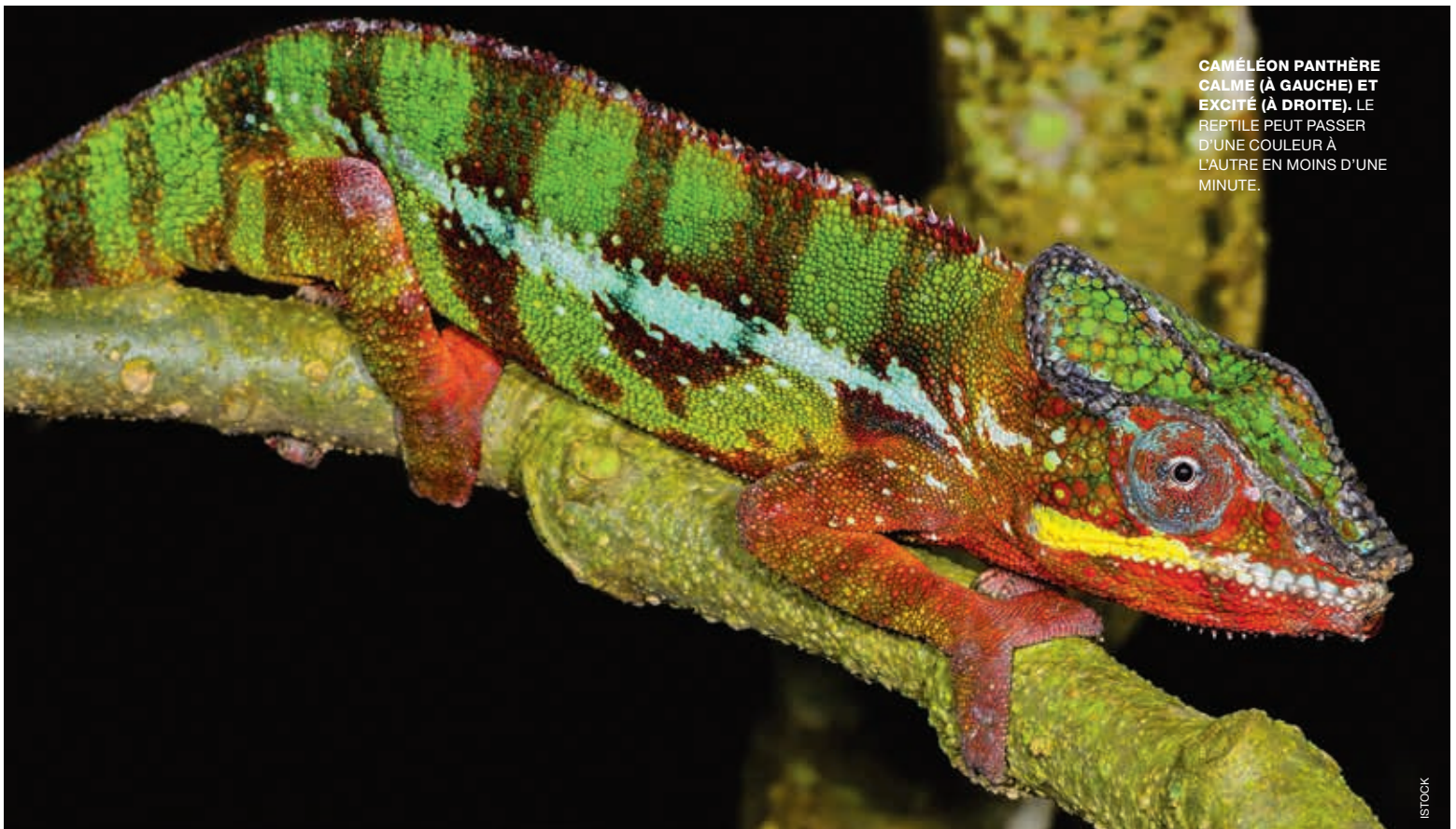
CAMÉLÉON PANTHÈRE CALME (À GAUCHE) ET EXCITÉ (À DROITE). LE REPTILE PEUT PASSER D'UNE COULEUR À L'AUTRE EN MOINS D'UNE MINUTE.