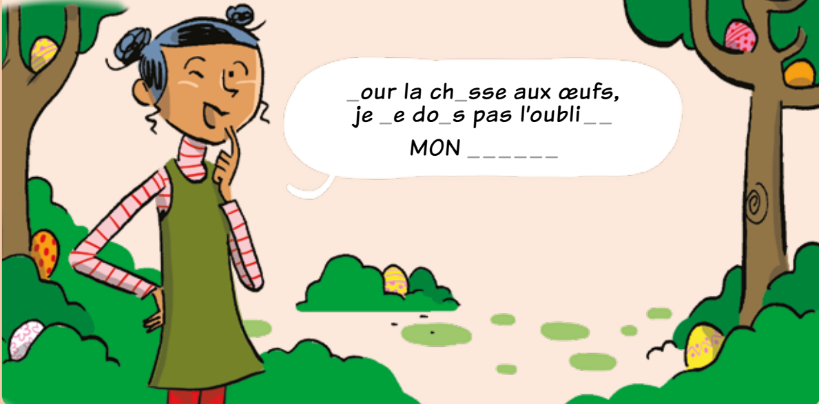
Illustration: Jérôme Sié

À quoi pense Luna? Pour le savoir, trouve les lettres manquantes de sa phrase et reporte-les sur la ligne en dessous.