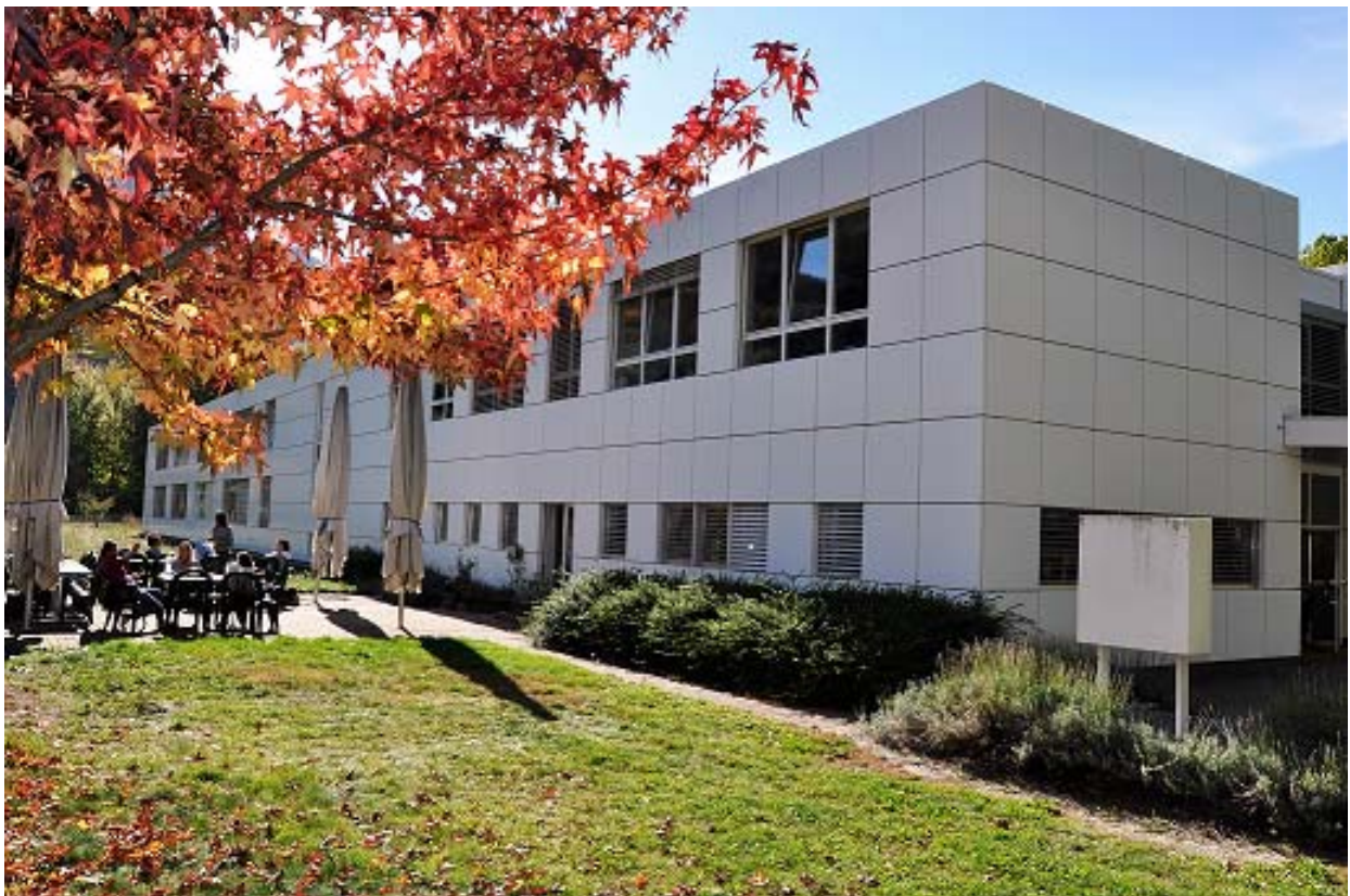
CIDE-UNIGE Valais Campus, Sion

CENTRE INTERFACULTAIRE EN DROITS DE L'ENFANT