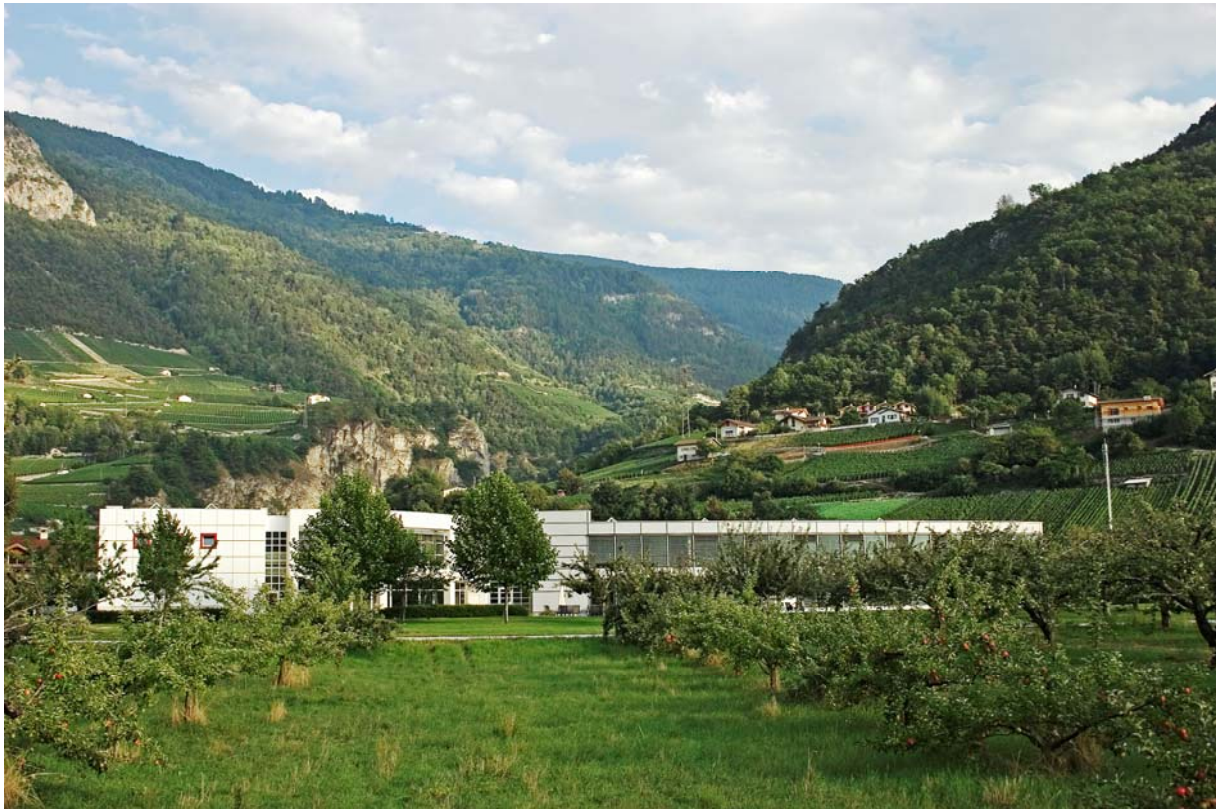
CIDE-UNIGE Valais Campus, Sion

CENTRE INTERFACULTAIRE EN DROITS DE L'ENFANT