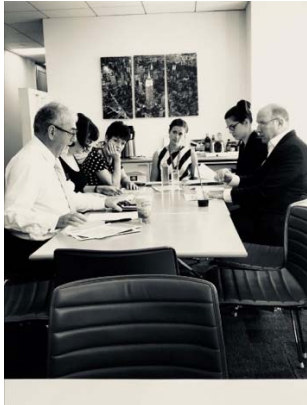
Derniers préparatifs avec l'équipe de campagne du Département fédéral des affaires étrangères.