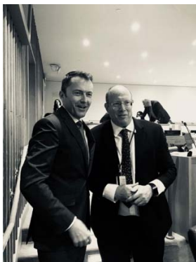
Le moment de la célébration après le vote avec S.E. Jürg Lauber, Ambassadeur de la Suisse auprès des Nations-Unies.