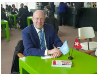
En campagne dans la Salle des délégués des Nations Unies à New York.