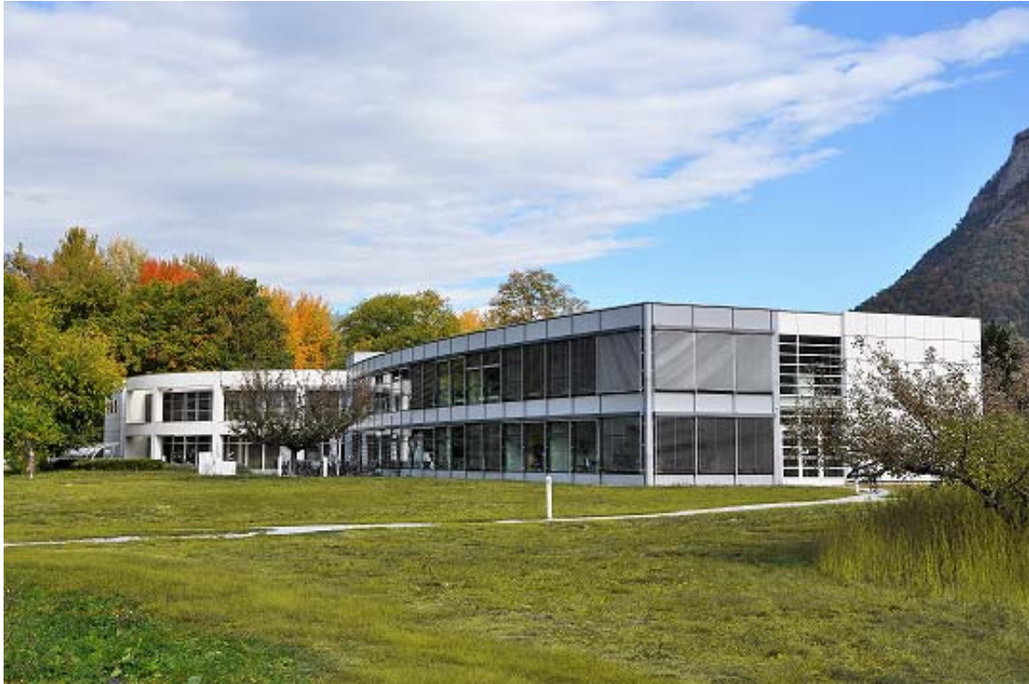
CIDE-UNIGE Valais Campus, Sion

CENTRE INTERFACULTAIRE EN DROITS DE L'ENFANT