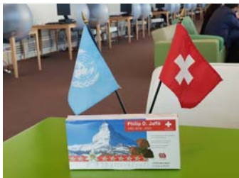
L'arme secrète d'une campagne helvétique : Le chocolat pour convaincre les représentants des Etats Parties.