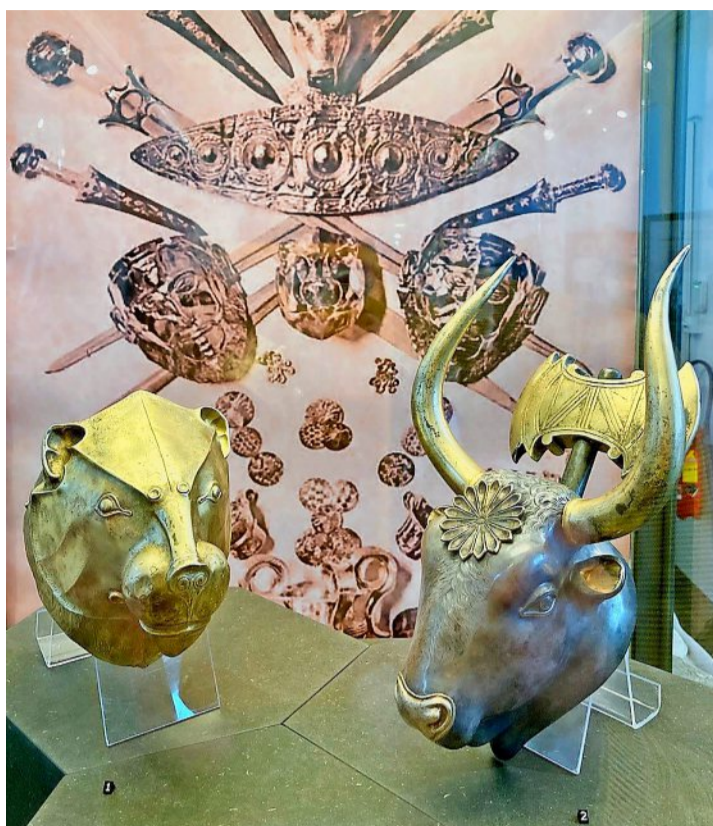
Ces deux pièces sont des créations par galvanoplastie de l'artiste Émile Gilliéron.

En effet, la production en série place ces copies à portée de bourse de la bonne bourgeoisie cultivée. Bien des monuments funéraires que l'on croit sculptés dans le bronze à grands frais sont en réalité des galvanoplasties, bien moins onéreuses. Les statues