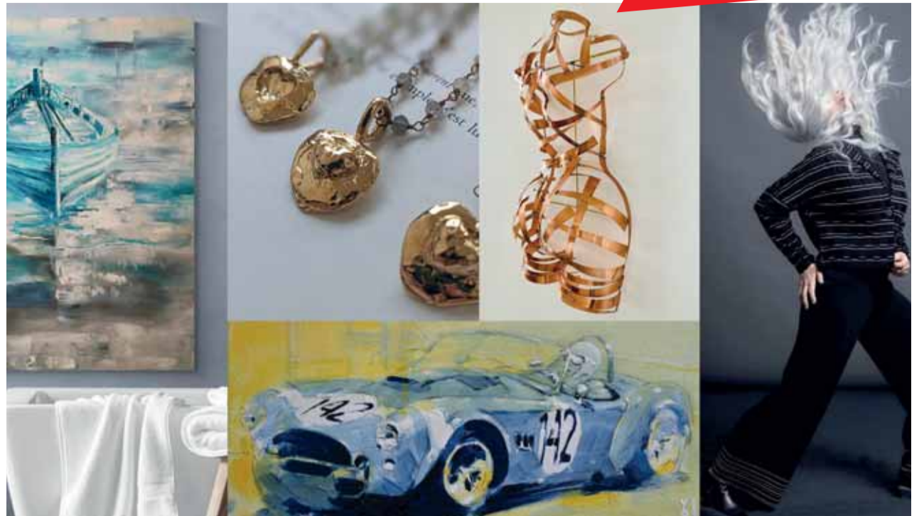
Des œuvres du monde entier seront exposées.

De nombreuses animations, dont des défilés de mode, des performances artistiques, des démonstrations, des ateliers de création et bien d'autres complètent le Salon. En fin de journée, place aux concerts, ambiance festive et restauration lors des Soirées au Château .