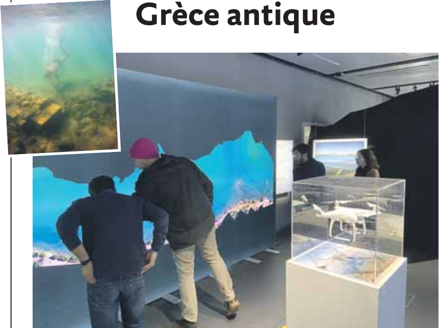
L'exposition met en lumière les recherches sous-marines réalisées par l'UNIGE.

EXPOSITION • Le Département des sciences de l'Antiquité de la Faculté des Lettres, en collaboration avec le Centre Universitaire d'informatique présente Immersum - Plonger dans le passé . L'exposition met en lumière les recherches sous-marines réalisées par l'Université de Genève dans la région de l'Argolide, située dans la péninsule du Péloponnèse, en Grèce. Les archéologues y étudient les vestiges de la préhistoire et de l'Antiquité, progressivement submergés par l'élévation du niveau