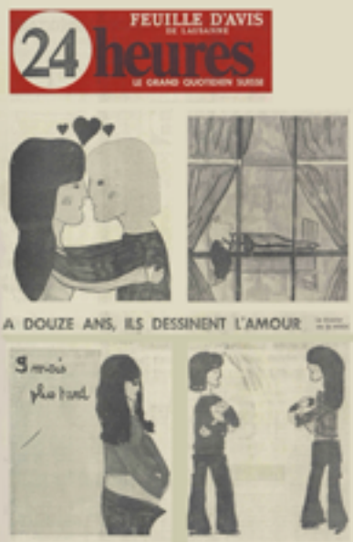
24 Heures, 06-07.01.1973