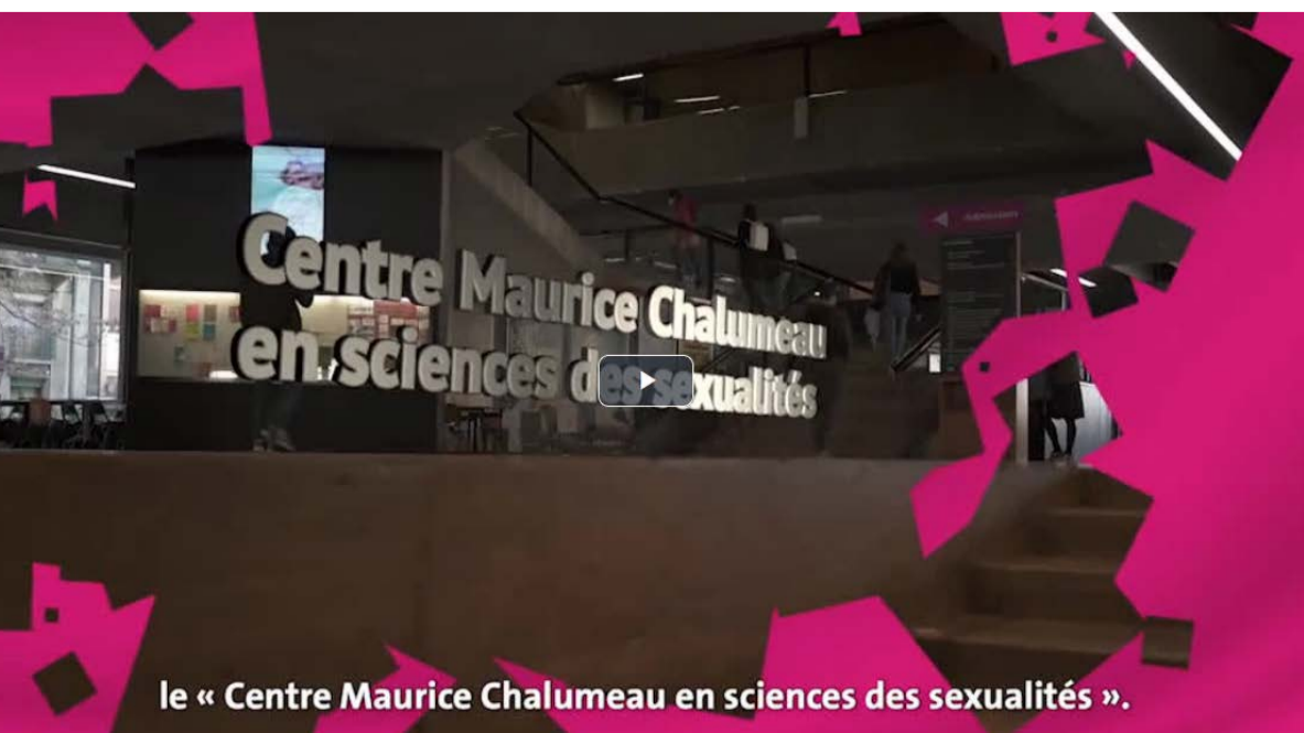
Vidéo de présentation du « Centre Maurice Chalumeau en sciences des sexualités » de l'Université de Genève [16 novembre 2020]

CENTRE MAURICE CHALUMEAU EN SCIENCES DES SEXUALITÉS