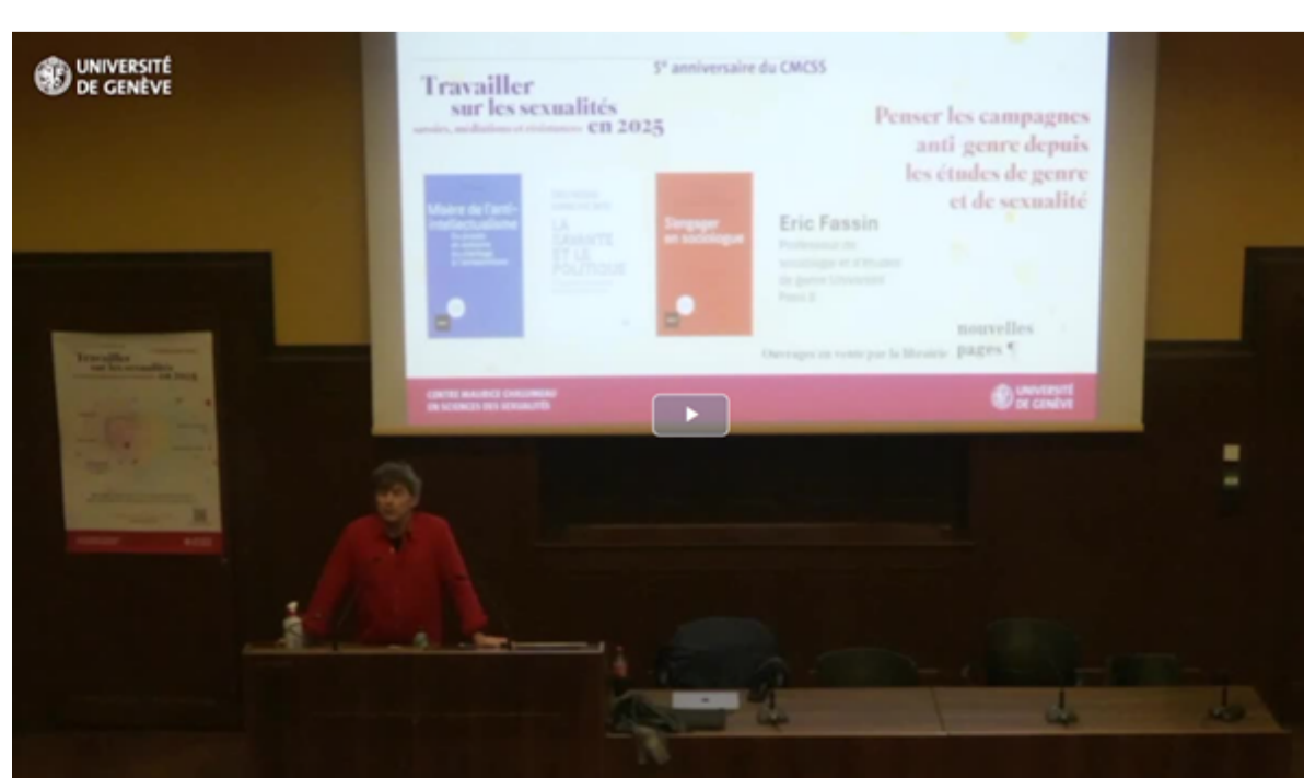
Penser les campagnes anti-genre depuis les études de genre et de sexualité Fassin Éric [26 novembre 2025]