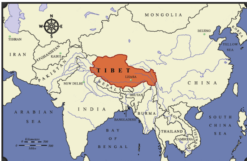
Carte du Tibet, http://media.betattp://media.betattp://media.bettp://media.http://betMap.jp8/TibetMap.jpg.htibetMap.jpg.08/TibetMap.jp8/TibetM&o=4,&o=4 , consulté le 6 janvier 2013

L'histoire du Tibet commence au VII ème siècle. Le roi Namri Songtsen de la dynastie Yarlung, puis son fils Songtsen Gampo unifièrent une multitude de petits royaumes barbares et redoutables pour former le Tibet. Ils dotèrent le nouvel état d'une capitale, Lhasa et d'une identité culturelle grâce à une religion, le bouddhisme et à une écriture. Le Tibet devint un grand empire redouté en Asie et connu, jusqu'au VIII ème siècle, une période de puissance et de gloire. Des affrontements avec la Chine eurent lieu mais ils débouchèrent sur un accord de paix entre les deux peuples qui définit la frontière.