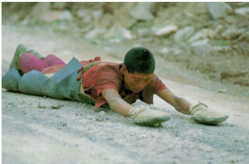
Le monde des religions , hors série n°1, septembre 2003, p.65

Les pèlerinages sont fréquents. Beaucoup se font aussi en se prosternant à chaque pas ou alors en marchant pieds nus.