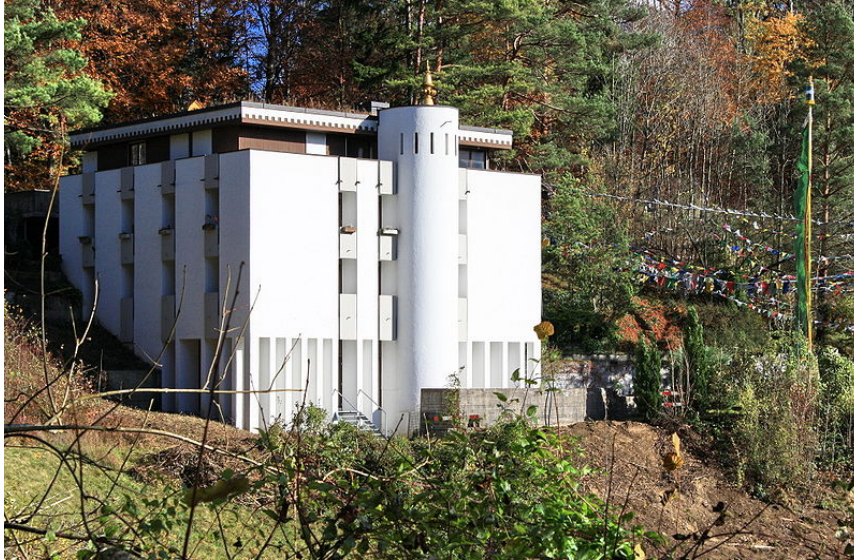
Institut tibétain à Rikon, près de Zurich, http://commonshttp://com/Filea.org/wiki/Filea.org/wikin_IMG_tute_RikonShiftN.jpg , consulté le 6 février 2013

En Suisse, il est possible de trouver à plusieurs endroits des temples bouddhistes tibétains. Le plus important se trouve à Zurich ; il en existe un autre dans le centre tibétain du Mont Pèlerin, près de Vevey 16 .