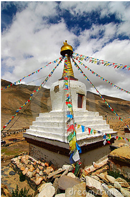
Stupa tibétain

« B : Il y a une chose. Nous avons beaucoup de monastères, peut-être que vous avez entendu parler du palais du Potala. Avant, sa Sainteté y résidait. La plupart de nos grands-parents se levaient le matin, à cinq heures du matin, ils se réveillaient, ils nettoyaient leur maison et ils sortaient pour aller au temple. Et ils tournaient en rond autour. C'est comme un exercice du matin. Un exercice en prière. B : Tous les parents pratiquaient en faisant de la méditation et en priant mais ici, en Suisse, nous ne pouvons pas pratiquer ainsi. Si tu veux faire quelque chose, tu ne peux pas le faire dehors, tu dois le faire chez toi, sinon ce n'est pas possible. Au Tibet, il y a des endroits spéciaux, des temples ou des stupas. A : Oui, c'est différent de là-bas. Au Tibet, nous pouvions aller n'importe où, il y a beaucoup de temples, alors c'est facile. » (Interview n°4 ; 9 :28)