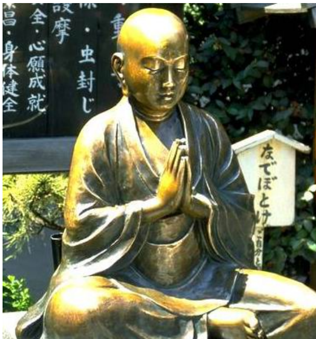
Bouddha, http://www.touche-pas-a-mon-tibet.com/page/page-4.html , consulté le 6 février 2013

Le Bouddha mourut à 80 ans à Kushinagara.