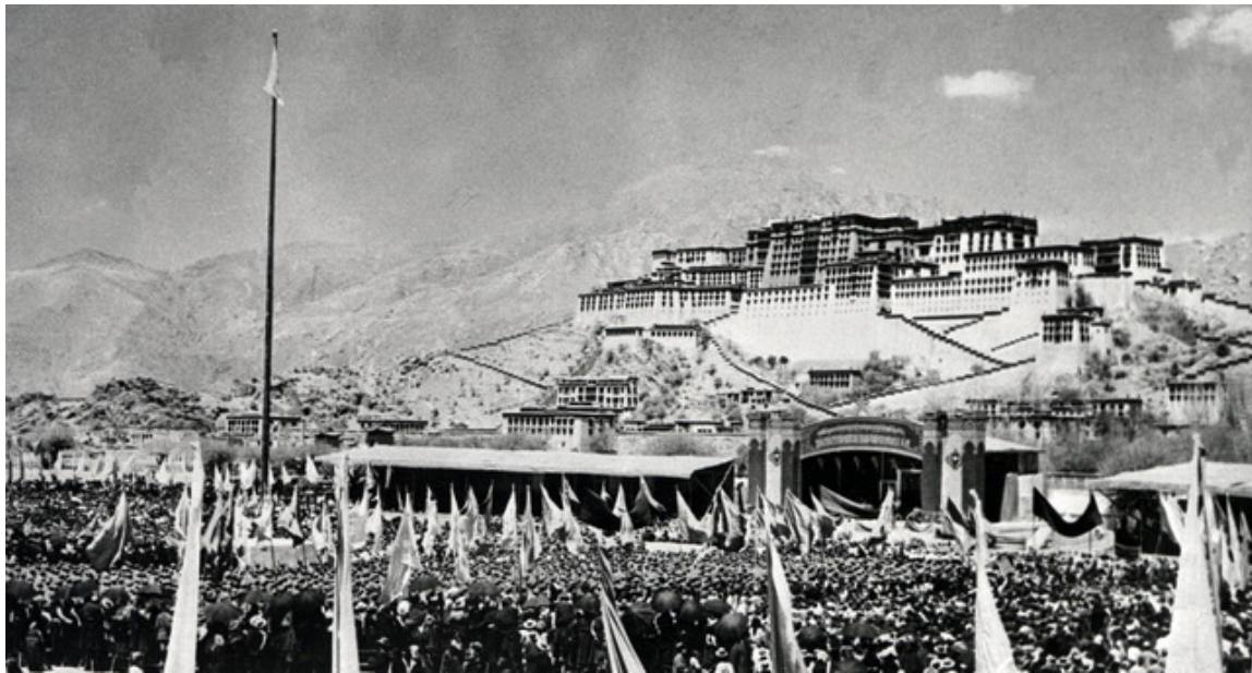
Palais du Potala lors des événements du 10 mars 1959, http://portfolio.lesoir.be/v/monde/2009_03_10_dalai_lama/7780932_PhDoc5_942121-01-08_jpg_0KG8I13C.JPG.html , consulté le 6 février 2013