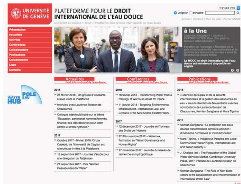
Site web de la Plateforme pour le droit international de l'eau douce, disponible en anglais et en français

Les Universités et Centres de recherche qui comptent une expertise juridique dans la gestion et la protection des ressources en eau sont très peu nombreux dans le monde. En Europe continentale, aucun centre de recherche et d'enseignement n'existe en ce domaine. Le droit offre pourtant une vaste palette d'instruments et normes pour régir au mieux la protection et la gestion de l'eau tant au niveau national que transfrontière. Qui plus est, le droit permet l'établissement de mécanismes pour prévenir et régler les conflits relatifs à la gestion des ressources en eau. Prenant en compte ces défis, des membres du Département de droit international public et organisation internationale (INPUB) de la Faculté de droit de l'Université de Genève ont créé la Plateforme pour le droit international de l'eau douce en décembre 2009, qui est progressivement devenue un centre d'expertise reconnu sur le plan mondial.