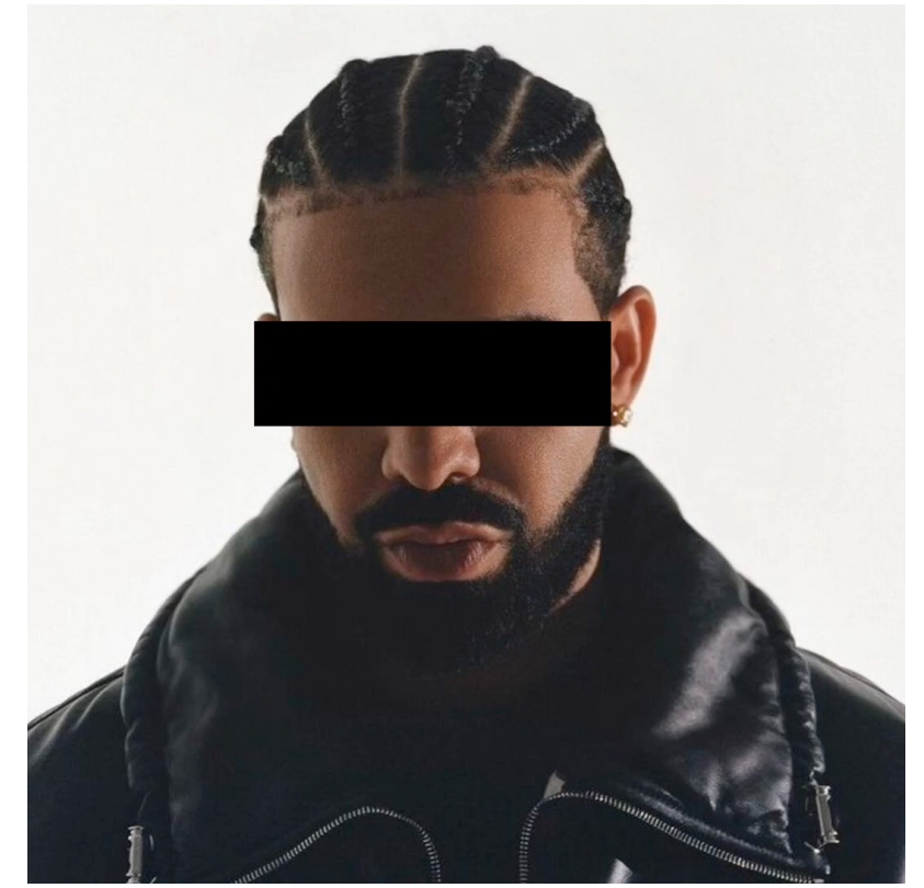
Al music "Heart on my sleeve"

Al-generated image titled 'Pseudomnesia: The Electrician', Boris Eldagsen's