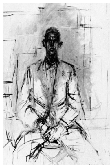
fin de la 18ère séance

Voici quelques uns des commentaires que Giacometti a exprimé tout au long des séances à propos de sa progression dans la réalisation du portrait: