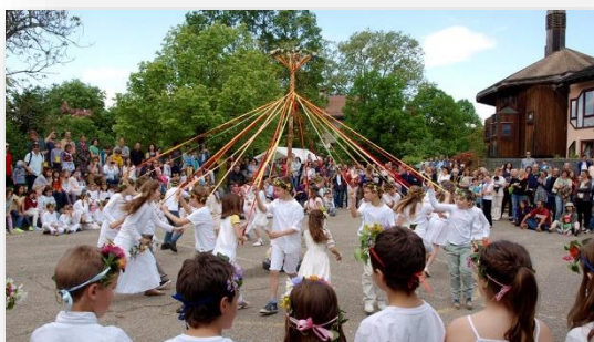
Fête du printemps de l'école Steiner de Genève