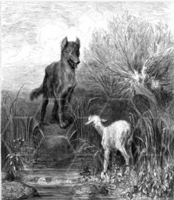
Jean de la Fontaine Le loup et l'agneau (1696)