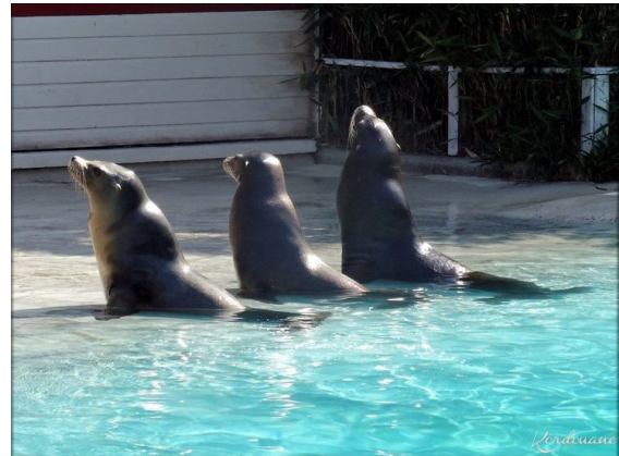
Otaries au zoo

J' ai rendu visite aux otaries. Quand je suis arrivé , elles s'amusaient à plonger et replonger dans un grand bassin assez profond. Ensuite, une jeune femme est arrivée avec un seau qu'elle avait rempli de poissons dont je ne connaissais pas le nom. Elle les a lancés aux otaries qui les attrapaient au vol : je n'avais jamais vu de spectacle aussi comique. Chaque jour, on leur donne à manger à la même heure.