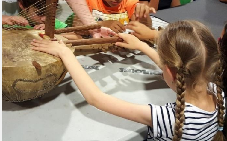
Projet «Petits explorateurs tactiles au Muséum» Les Doigts Qui Rêvent / SMAS / CLLE / Muséum de Toulouse