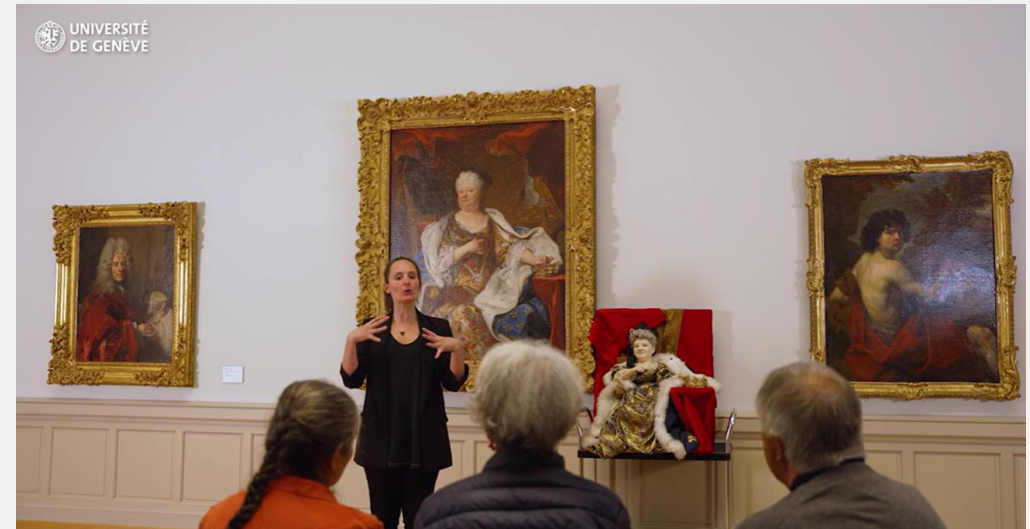
Visite descriptive au Musée d'Art et d'Histoire – MOOC Handicap visuel