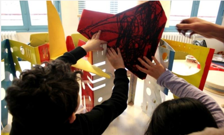
Projet «Hervé et moi» Les Doigts Qui Rêvent / Hervé Tullet /Ecole Parmentier-Paris