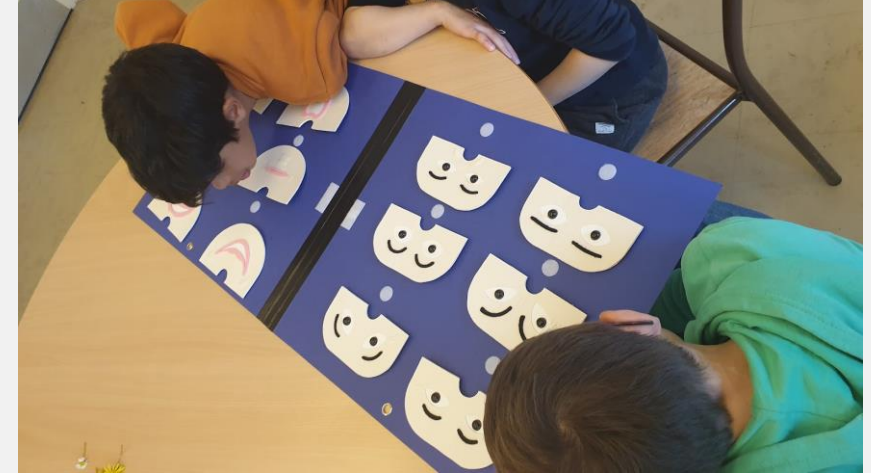
Projet «Emoti-Sens» SMAS/ DIPHE/Mes Mains en Or