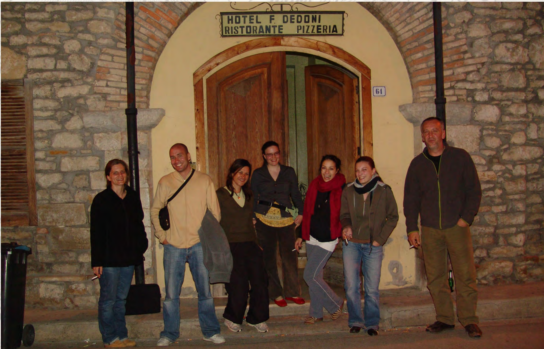
Devant le mythique hôtel de Gergei (province de Cagliari), copieux festin, musique et babyfoot : heureux moments de détente !