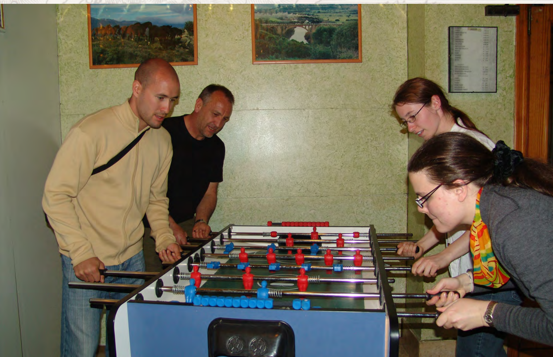
Championnat international de babyfoot de l'unique bar de Gergei !