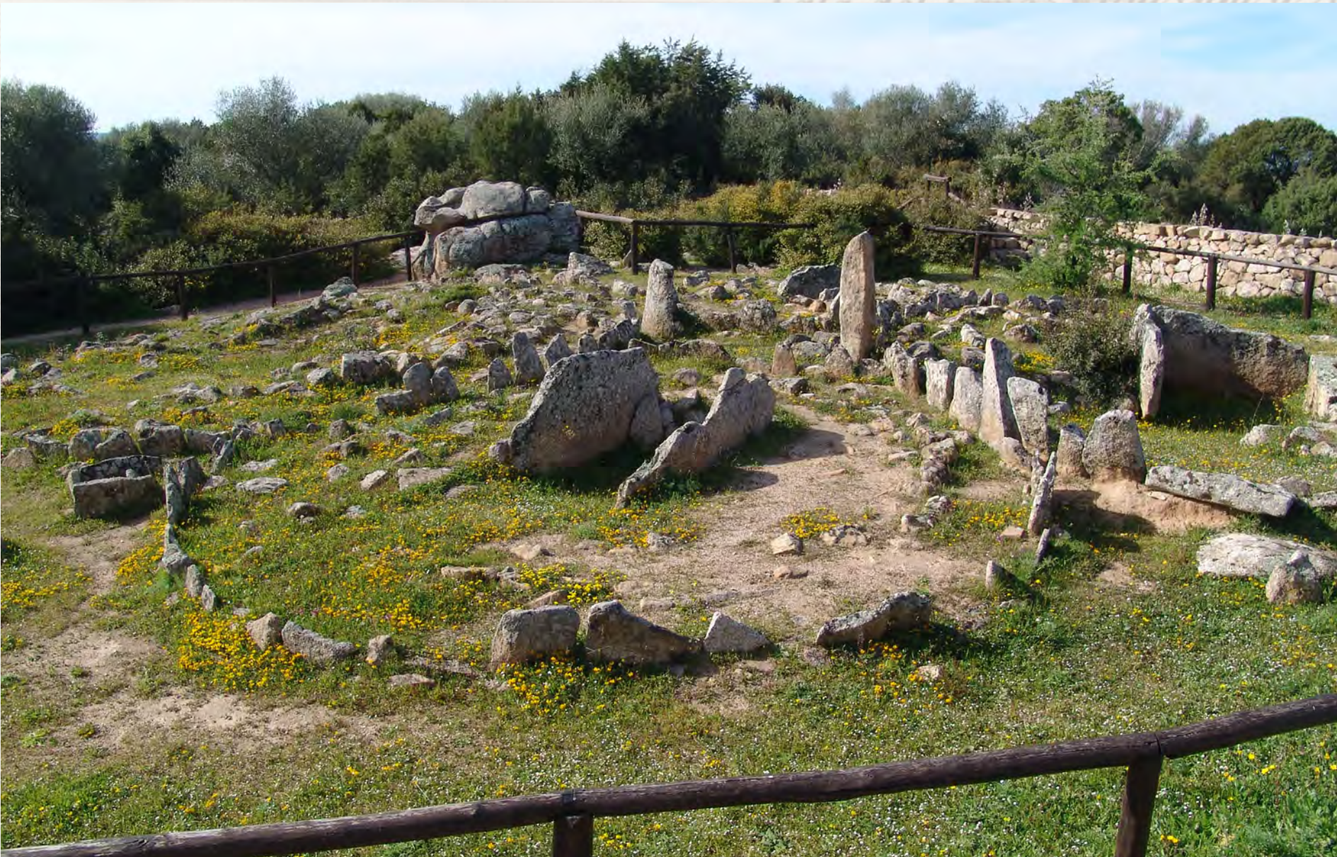
Nécropole de Li Muri (province d'Olbia-Tempio) : tombes en cistes dolméniques, entourées de petites buttes circulaires.