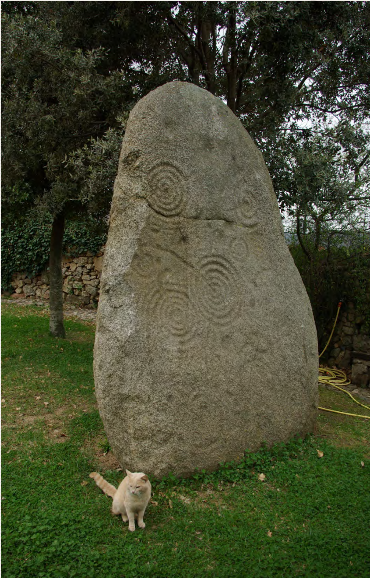
Le fameux menhir de Boeli (province de Nuoro), au milieu d'une propriété privée.