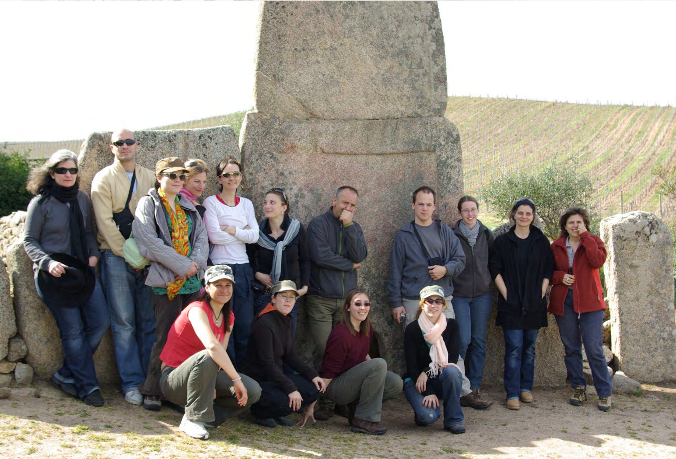
Photo de groupe : parce que l'archéologie, c'est surtout un travail d'équipe !!!