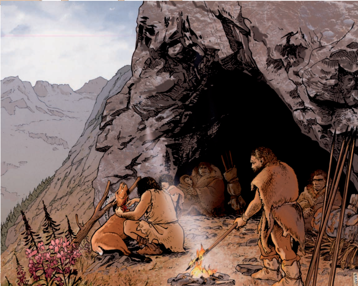
Fig. 1 : Une grotte près de Tanay (Vouvry, Valais) à l'altitude de 1660 m. Un Néandertalien découpe un bouquetin avec un outil en silex, un autre durcit des épieux au feu. Image tirée de Gally 2006, dessin d'André Houot