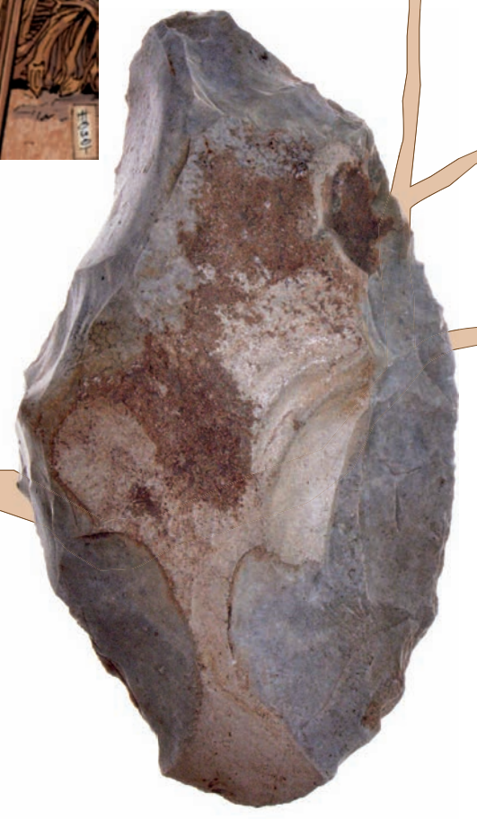
Fig. 3 : Outillage en pierre taillée : un racloir.