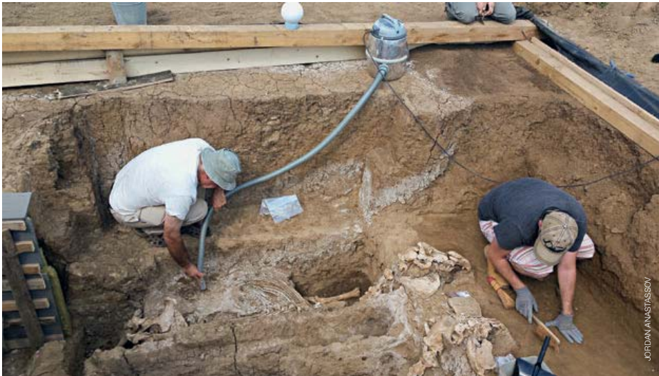
LES ARCHÉOLOGUES FOUILLENT UN CHAR CELTIQUE ENCORE ATTELÉ À DEUX CHE- VEAUX DEBOUT.

chiite. Ce sont des alévis qui possèdent d'ailleurs à l'intérieur même de la réserve archéologique un lieu de pèlerinage, un mausolée datant du XVI e siècle construit en l'honneur d'un de leurs saints, Demir Baba. Très vivant, ce petit temple attire aussi, à des dates différentes de l'année, les fidèles d'autres religions présentes dans la région, qu'elles soient musulmanes sunnites ou chrétiennes.