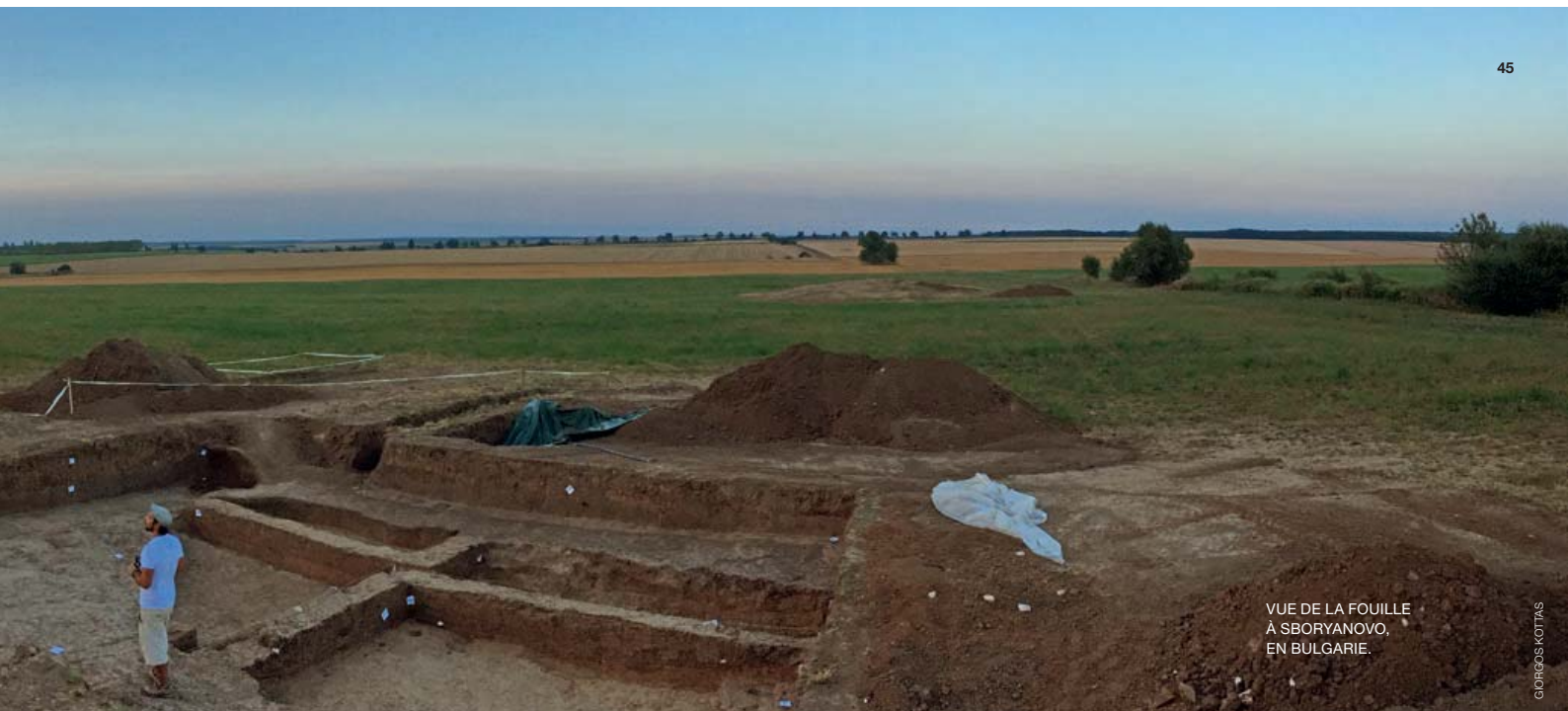
VUE DE LA FOUILLE À SBORYANOVO, EN BULGARIE.