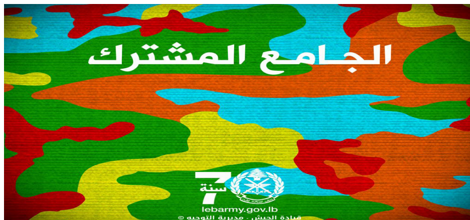
Fig. 6 : « L'Unificateur commun » 220

« l'unificateur commun » 219 comme slogan. Ainsi, l'uniforme devrait unir malgré toutes les divergences politiques les citoyens libanais avec toutes leurs différences sous le drapeau et l'institution militaire.