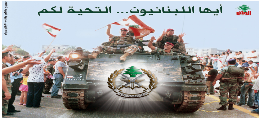
Fig. 7 : « Ô Libanais, le salut est à vous »

Le brandissement de tous ces symboles - le drapeau en lambeau, les soldats souriants et la population en admiration - font de l'armée une icône de la sécurité nationale et son seul garant dans laquelle se reconnaissent les citoyens de diverses confessions. De plus, lors des événements que relate cette image, les différentes figures politiques ont soutenu l'institution militaire. En effet, les politiques y voient non seulement un processus de légitimation de leur discours, mais aussi une manière de montrer leur appartenance à cette institution nationale libanaise.