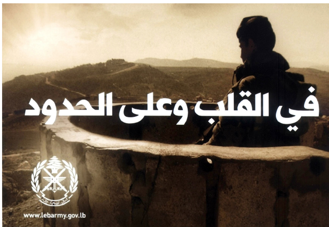
Fig. 10 : « Dans le cœur et sur les frontières » 257