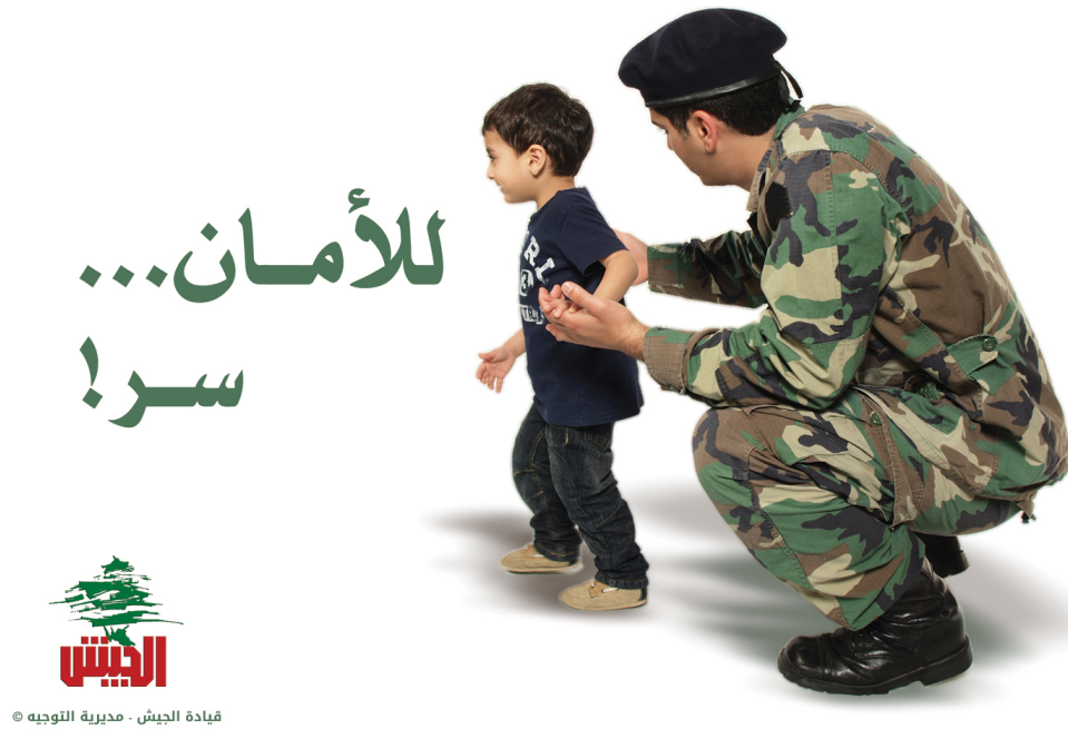
Fig. 8 : « En Avant, Marche! » 255