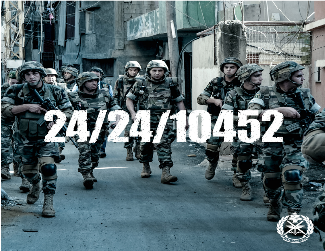
Fig. 5 : « 24/24/10452 » 215

En articulant ce slogan sur différents fonds et scènes, l'armée arrive à montrer sa présence sur l'ensemble d'un territoire fragmenté, où diverses milices et forces armées sont en compétition à certains moments, notamment dans les camps palestiniens ou syriens, les régions frontalières avec le voisin syrien et le Sud Liban où le Hezbollah est fortement présent. Légitimer la présence de l'armée sur l'ensemble du territoire en fait un corps qui ne contrôle pas une région plus qu'une autre, sous des prétextes confessionnels. Elle fut victime de telles accusations lors des événements de Tripoli entre 2011 et 2014 216 (sur des étapes différentes) ou plus fortement celle de Saïda de 2013 217 . Dès lors, ces figures ne sont pas de simples images mettant en scène l'armée, elles sont désormais des méthodes de pouvoir afin de contrer les risques qui pourraient amener à son écroulement, si son équilibre était mis en jeu, notamment par des discours exacerbant les appartenances communautaires ou la souveraineté. Ces deux aspects fragiliseraient l'armée au point de l'écroulement.