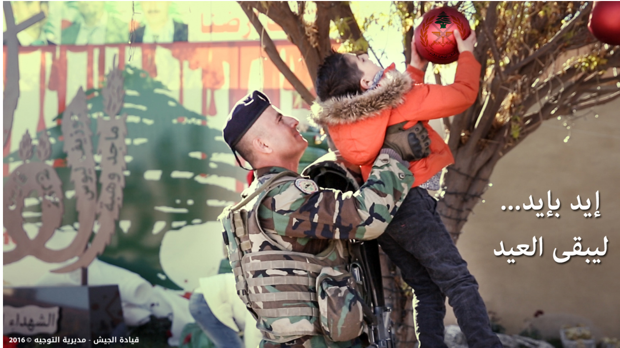
Fig. 11 : « Main dans la main pour fêter toujours » 258