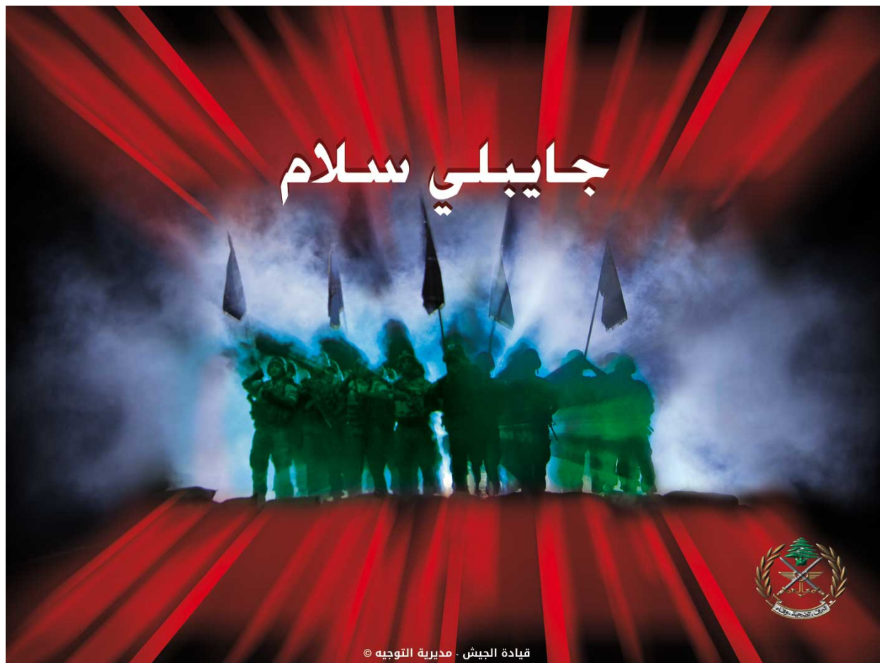
Fig. 14 : « Il m'amène la paix » (chanson de Fayrouz. Usage de la culture populaire) 261