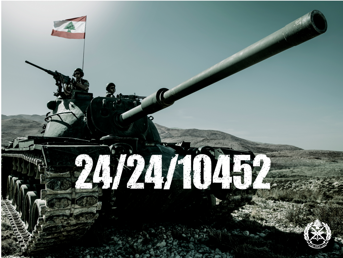
Fig. 4 : « 24/24/10452 » 214

Dans la figure 4 datée de 2016, nous observons, à nouveau, une scène réaliste dans un milieu montagnard libanais avec un fort slogan numérique. Par ce dernier, l'armée affiche sa force militaire, mais surtout sa présence sur l'ensemble du territoire libanais, aspect parfois remis en question. Ainsi, par cette image l'armée affirme sa présence vingt-quatre heures sur vingt-quatre sur l'ensemble des 10'452 km 2 du territoire libanais. La mise en scène du drapeau libanais flottant sur le tank reflète la valeur nationale de cette armée, et encore une fois de la mise en avant des éléments du nationalisme banal qui cherche à rappeler constamment l'existence de la nation. Ici, ce concept de nation est rattaché à l'intégrité territoriale. Ce drapeau non seulement flotte au-dessus du tank mais flotte, comme l'armée, sur les 10'452 km 2 du Liban sur lesquels cette armée prouve sa souveraineté, sa force et sa présence non questionnable.