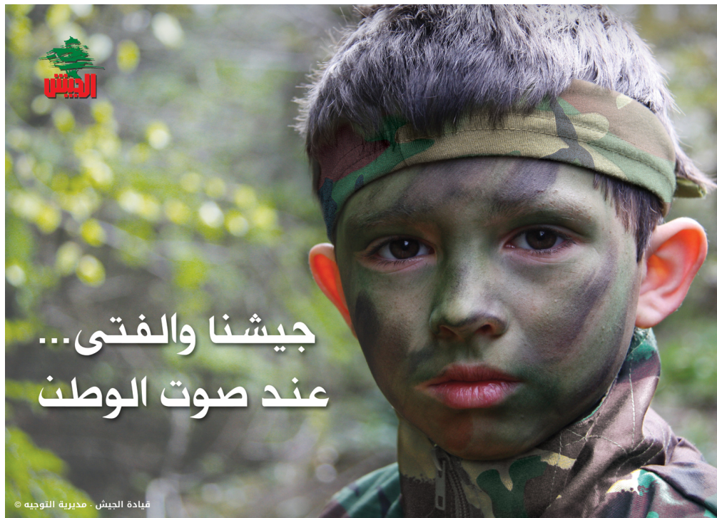
Fig. 12 : « Notre armée et nos enfants à l'appel de la nation » (jeu de mots avec l'hymne national) 259