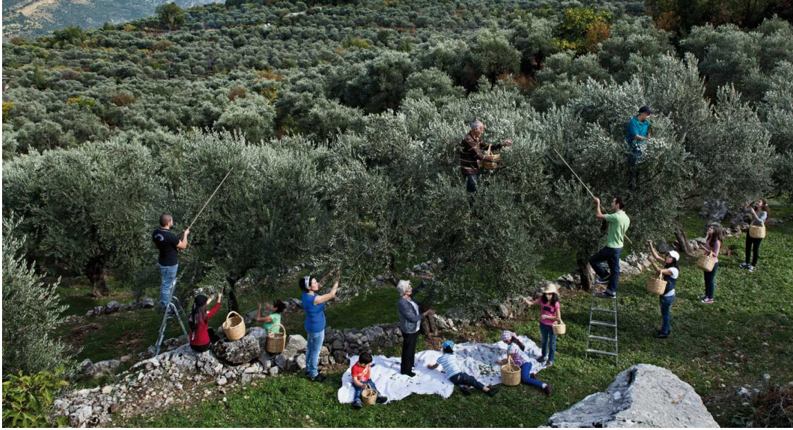
Fig. 13 : « Ton peuple t'aime » 260