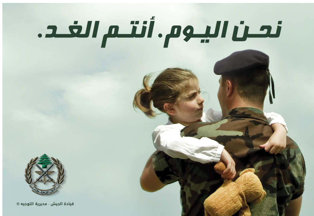
Fig. 9 : « Nous aujourd'hui. Vous demain » 256