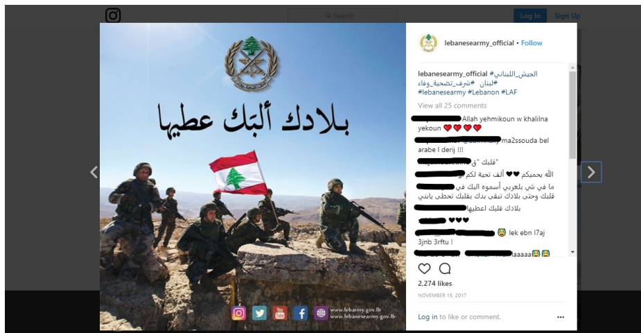
Fig. 2 : Image de l'affiche précédente publiée publiquement 212

La figure 1, affichée durant la semaine de la fête de l'indépendance (célébrée le 22 novembre) en 2017, et les célébrations de cette dernière utilisent ce cadre pour un but bien précis. Quelques mois auparavant, l'armée était prise dans des opérations dans la Bekaa, à l'Est du pays, contre des cellules islamistes. Le fond sur lequel sont affichés les soldats de la figure 1 renvoie à l'image de la région de la Bekaa, où les combats ont eu lieu. Plus tôt en 2007, les campagnes de soutien à l'armée pendant, et suivant la bataille de Nahr el Bared, faisaient fureur à la télévision 211 .