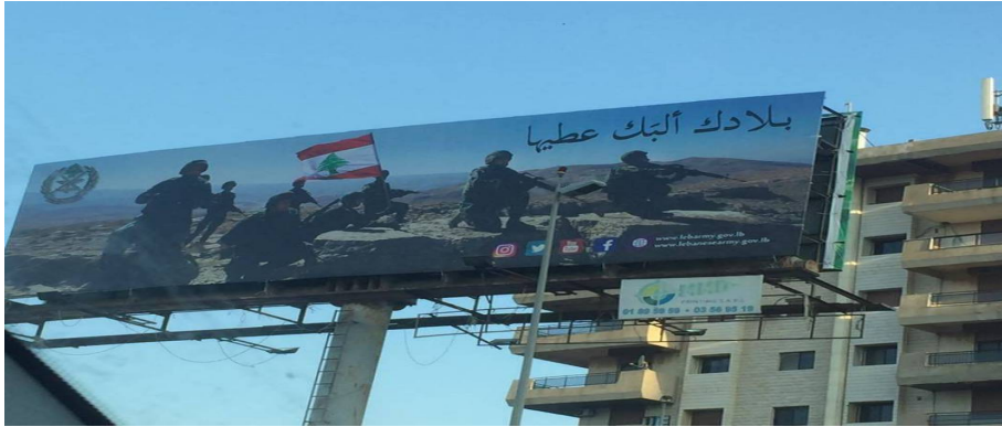
Fig. 1 : in Al Nahar 16 novembre 2017 204

Dans la logique de « saison » de brandissement de l'armée, la campagne « Bladak Albak A'tiha 202 » (fig.1) de novembre 2017 est un exemple significatif. De plus, il est intéressant de voir l'élaboration d'une communication active de la part de l'armée via les réseaux sociaux. Ainsi, ces images d'édification de l'armée en héros national sont exposées sur Instagram, Facebook, Twitter (fig.2). Sur ses réseaux sociaux, nous observons une interaction avec un public qui s'exprime, donne son avis et commente. Le premier commentaire dans la fig.2 demande que Dieu ( Allah en arabe ne se réfère pas au « Dieu des musulmans » mais est l'équivalent de Dieu avec un « D » majuscule) protège les soldats et les préserve « à nos côtés » 203 .