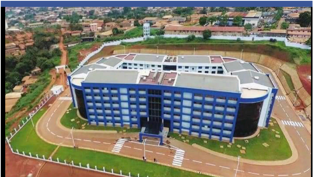
Figure 2 : Siège Fonds Spécial d'Équipement et d'Intervention Intercommunale (FEICOM)

La seconde, concerne des initiatives privées, souvent à vocation commerciales ou résidentielles, telles que les résidences individuelles ou les immeubles de bureaux. Certaines architectes de cette enquête collaborent régulièrement avec la Société Générale pour la construction de leurs bureaux à Yaoundé et dans d'autres villes du Cameroun.