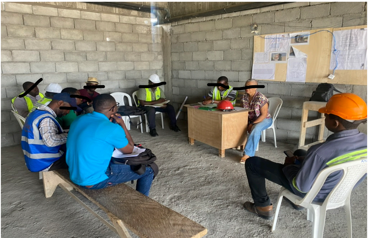
Figure 5 : Photo prise par l'auteurice sur le chantier à Sangmélima représente une des femmes architectes interviewées et l'équipe sur le chantier

Toutefois en tant que femmes, elles sont confrontées à des obstacles liés aux stéréotypes, d'autant plus lorsqu'elles occupent des postes de cadres ou de management. Elles évoluent dans un secteur majoritairement masculin à tous les niveaux, que ce soit au sein de leur corps professionnel 63 ou dans la gestion des ouvriers sur les chantiers de construction.