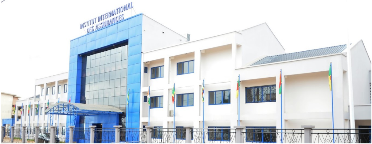
Figure 1 : Institut international des assurances Yaoundé, Cameroun