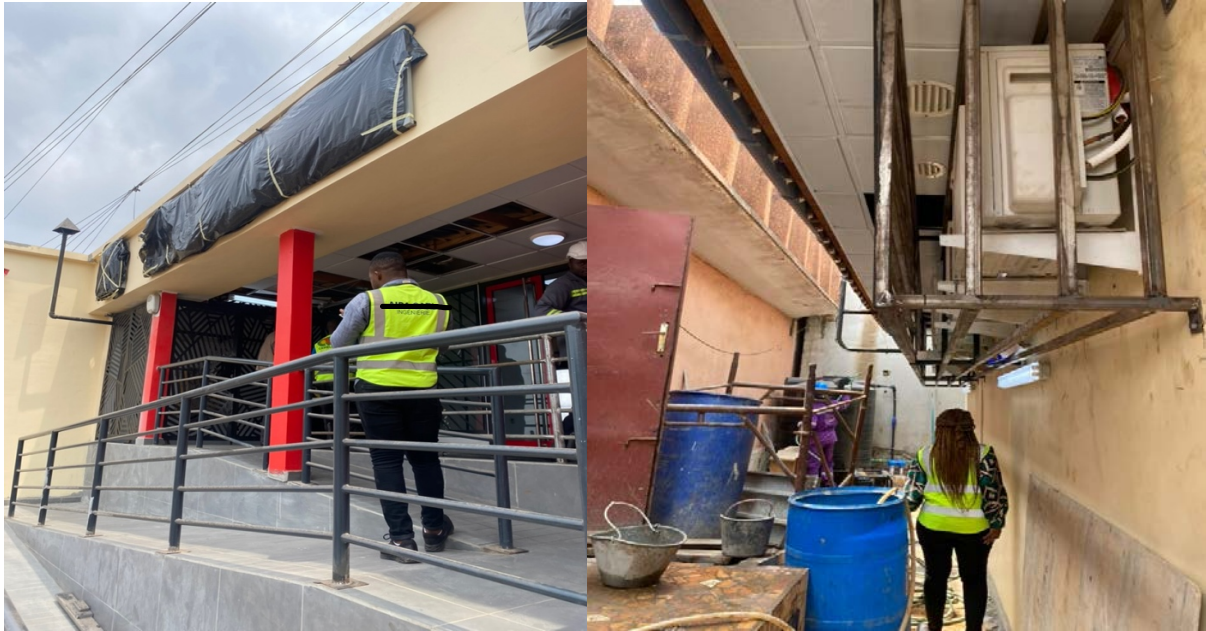
Figure 3 : Photos prises par l’auteurice sur le chantier d’un des bureaux de la Société générale MimboMan Yaoundé

Cependant, malgré cette organisation apparente, le secteur reste marqué par des dynamiques informelles, notamment en matière de titres fonciers et de permis de construire 5 .