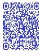
QR code récit de vie

Les images de cette femme combattante qui occupait une position importante dans le M23 dénote aussi de cette performativité qui caractérise le militarisation des subjectivités féminines dans le groupe armé, brouillant parfois les rôles traditionnels de genre. D'autant que certaines combattantes parlent du métier des armes, comme un métier où il n'existe pas de différence de sexes. De la bouche même d'une femme ex-combattante dans le documentaire de Lamorre et Tosarelli : « Le travail de soldat, c'est comme le service de Dieu. Et dans le service de Dieu, il n'y a pas de femme et homme. Nous sommes tous des soldats » 332 .