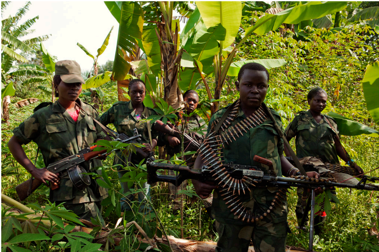
Image 2. Photographie de femmes combattantes (parmi elles, sans doute aussi des enfants soldats, au vu de l'apparence juvénile de certaines) Mai-Mai Shetani/FPD, Nyamilima, North Kivu, RDC 16

Des études ont même montré que certaines combattantes rejoignent volontairement les groupes armés et y jouent une myriade de rôles 17 . Si certaines d'entre elles sont victimes d'exploitation (sexuelle notamment), d'autres peuvent acquérir un sentiment d'autonomisation grâce à leur participation à des groupes armés 18 , une question importante, que cette exclusion épistémique, hélas, ne permet pas de considérer. Or, mettre en lumière la place des femmes qui font usage de la violence dans des contextes collectifs, c'est sortir d'une double dissymétrie. D'un côté celle qui nous amène à reconnaître, que le schéma et la réalité des « violences sur les femmes » l'emportent largement sur la violence des femmes ; peu perçue, ou du moins peu considérée, comme je viens de le montrer. De l'autre, celle qui consiste à reconnaître que l'accès des femmes, tout autant que celui des hommes, au pouvoir de la violence peut détenir une dimension politique et émancipatrice et l'on doit reconnaître, dans certains cas, sa légitimité 19 . C'est ce que je me suis attelé à montrer tout le long de cette monographie, qui explore les expériences vécues des femmes combattantes dans les groupes armés, de leur socialisation avant leur recours aux armes jusqu'à leur transition vers la vie civile, dans le conflit à l'est du Congo.