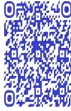
QR code récit de vie

Récit d'une expérience de vie où la violence est omniprésente, partout, tant dans la vie d'avant leurs recours aux armes que dans celle d'après. Récit aussi, par ricochet, d'une société où la violence a été popularisée 212 . Récit enfin, d'une expérience de vie marquée par une sorte de voisinage avec la mort, faisant référence à l'expérience des sociétés, comme celle à l'est du Congo, ou Gazaouite par extension, où la violence de la mort est devenue l'état normal des choses 213 . Celle-ci est une réalité directe, quotidienne, et concrète pour les corps, montrant comment la guerre, en tant qu'espace nécropolitique a octroyé « à la mort une place centrale aussi bien dans les processus de constitution de la réalité que dans l'économie psychique en général » 214 . Une expérience psychique de la mort est d'ailleurs apparue dans le récit de vie de cette jeune femme combattante qui combat chez les Maï-Maï Shetani dans le documentaire de Lamorré et Tosarelli :