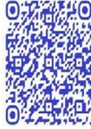
QR code récit de vie

« Quand tu deviens combattante, tu perds l'esprit civil. Tu repenses aux souffrances, aux moments difficiles, tout ça c'est en toi. L'esprit civil disparaît alors définitivement. Il faut être solide c'est ça le problème » 349 .