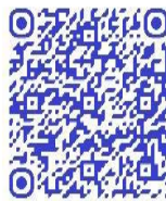
QR code récit de vie

« Je suis entrée dans ce travail depuis 1989. Mon père était aussi un soldat, quand il est mort durant la guerre de 1982, c'est alors que j'ai éprouvé de la colère, que mon père puisse mourir, il avait le grade de premier lieutenant, et je me suis engagée dans ce travail de soldat jusqu'à aujourd'hui. Je ne peux pas avoir peur, je ne suis née dans une famille de soldats, et pour ma terre, je mourrai soldat, je ne retournerai jamais dans la vie civile » 250 .