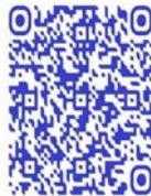
QR code récit de vie femme ex-combattante

« Tous les civils ont peur de nous. Ils ont besoin de nous. Les hommes nous appellent pour que l'on soit leur amante. Mais quand on s'approche d'eux. Ils nous disent : « on a entendu que vous êtes des tueuses ». Ils ne prennent pas le temps de savoir si c'est vrai ou pas » 197 .