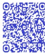
QR code récit de vie

« Je suis venue ici parce que nous avons beaucoup souffert dans nos villages. La milice rwandaise venait piller nos biens et violer nos femmes. J'ai alors décidé de prendre les armes. Depuis que nous sommes dans la milice ; nous sommes braves. Mais il y a de moins en moins de combats » 170 .