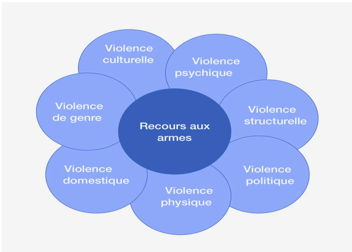
Graphique réalisé par l'auteur. Représentant les dynamiques de « compénétration des violences » à l'œuvre dans les itinéraires sociaux de ces femmes combattantes

Comme ce recours aux armes s'inscrit dans un contexte de domination, comme je l'ai montré, il doit ainsi être saisi comme une « praxis absolue », au sens où le suggérait Fanon de la situation coloniale : « Cette praxis violente est totalisante, puisque chacun se fait maillon violent de la grande chaîne, du grand organisme violent surgi comme réaction à la violente première du colonialiste » 233 .