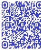
QR code récit de vie

« Moi je suis toujours une femme, puisque le seigneur m'a conçue comme une femme, femme parce j'ai des seins, j'ai aussi un vagin, mais quand il s'agit de combattre, de défendre mon pays, je ne suis plus une femme » 351 .