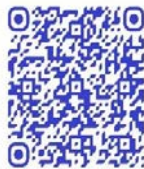
QR code récit de vie

« Je ne peux rien envier à ma vie d'avant, parce que rien ne marchait. C'est pour cela que j'ai rejoint l'armée » 200 .