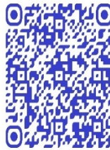
QR code. Séquence vidéo Femmes combattantes URR 184

D'autres femmes combattantes, cette fois dans les FARDC, qui apparaissent dans le documentaire de Lamorré et Tosarelli, font partie d'un commando spécial, l'unité de réaction rapide (URR) :