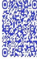
QR code récit de vie

En plus de parler du maniement des armes, certaines de ces femmes ont aussi développé des registres de justification. Ce sont ces registres qui, dans certains travaux, conduisent à les considérer comme des actrices idéologiques, mettant en évidence leur agentivité, leur discours ou leur conscience politique. Loin de moi l'idée de refuser à ces femmes toute capacité de penser idéologiquement leur action, mais à bien y regarder, ces registres de justification ont surtout trait à la guerre et au métier des armes.