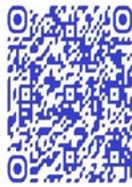
QR code récit de vie

« Après avoir quitté la milice nous sommes retournés dans nos villages. Les villageois nous ont poursuivis, deux compagnons ont été tués à coups de pierre. Je ne peux pas retourner à Nyazale, mon village natal. Ils savent que j'ai été milicienne, ils vont me lapider. Eux n'oublient pas ce que tu as fait, les mêmes qui ont tué ton mari, tes parents, ta femme, attendent que tu reviennes pour t'achever à ton tour. Je ne peux rien dire de plus » 286 .