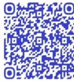
QR code récit de vie femme ex-combattante

« Après avoir quitté la milice nous sommes retournés dans nos villages. Les villageois nous ont poursuivis, deux compagnons ont été tués à coups de pierre. Je ne peux pas retourner à Nyazale, mon village natal. Ils savent que j'ai été milicienne, ils vont me lapider » 196 .