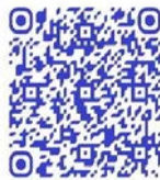
QR code récit de vie

« Ma famille n'est pas d'accord c'est moi qui aime être ici. Les voisins disent toujours à ma mère : laissez-la se battre pour le pays, quand la paix sera revenue, elle rentrera, laissez-là là-bas, on verra si elle va se fatiguer de combattre » 237 .