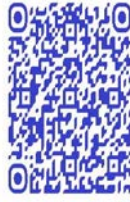
QR code récit de vie

Comme on peut le lire avec ce biographème de vie d'une femme combattante extrait du documentaire de Lamorré et Tosarelli, l'expérience de la violence est autant familiale (matrimoniale dans son cas : dépossession des biens, polygamie) que politique (les massacres perpétrés à l'est du Congo), vécue autant de façon directe qu'indirecte. Le recours aux armes doit ainsi être restitué dans le contexte d'un pays ou d'une région, l'est du Congo, non seulement marqué par la violence du conflit, mais aussi où la vie civile est particulièrement difficile. Dès lors, il doit donc être compris comme une façon de donner sens, une réponse, à un contexte sécuritaire et social en pleine mutation. C'est en ce sens qu'on peut interpréter les préoccupations sécuritaires dont cette femme est porteuse, mais que Vlassenroot et al. documentent aussi dans la mobilisation des jeunes hommes à l'est du Congo 202 . Car dans un contexte de prolongement conflictuel comme celui de l'est du Congo, la plupart de ces femmes n'ont connu que la guerre :