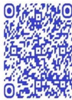
QR code récit de vie

« La peur ? La peur, non, je n'en avais pas, si j'avais eu un travail correct avec du respect mutuel, j'y serais encore, mais ce qui m'a fait partir c'est de devoir piller les gens et les tuer, je n'ai aucun bon souvenir chez les Maï-Maï, rien de ce que j'ai fait ne m'a rendue fière, tu dois obéir aveuglement à quiconque te dépasse en grade, c'est à toi de savoir où tu vas et d'où tu viens, même pour manger, nous devons piller les villageois et leurs champs, sans ravir les vêtements à quelqu'un, pas moyen de s'habiller, fort, fort, je demande pardon aux personnes à qui j'ai fait du mal » 263 .