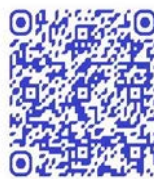
QR code récit de vie

« Normalement il doit y avoir une différence entre les hommes et les femmes. Une femme doit être coquette, se faire belle, c'est pour cela qu'on nous appelle les PMF, Personnel Militaire Féminin. Le mot féminin implique toute la différence. Quand je suis en tenue civile, je m'habille comme je l'entends. Mais en tenue militaire, je me comporte comme un homme » 353 .