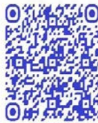
QR code récit de vie

« Il faut avoir le cœur dur pour faire ce métier, si tu vois que l'un de ton groupe est mort, tu ne craques pas, tu continues le combat » 347 .