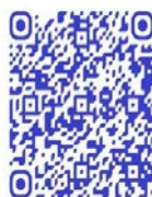
QR code récit de vie

Si ce ne fut pas son cas, ces réseaux de relations, parfois même sentimentales comme c'est le cas de ces deux femmes ex-combattantes, ne doivent pas faire oublier que certaines femmes subissent des agressions sexuelles dans les groupes armés 317 . Et aussi, comme le montre Bucaille, le fait lorsque les femmes endossent le rôle de combattantes, leur présence dans les rangs produit une situation de mixité qui débouche sur la nécessité d'une régulation de l'économie sexuelle 318 . Néanmoins, dans un contexte social où elles souffrent de stigmatisation, ce qui complique, pour certaines d'entre elles, leurs rapports sociaux avec leur communauté d'origine, ces liens de camaraderie ou ces réseaux de relations, montrent comment le groupe armé devient un espace social alternatif pour elles. Une femme ex-combattante dans le documentaire de Lamorre et Tosarelli, qui s'est retrouvée en situation de rupture familiale comme la première femme de mon entretien, exprimait clairement cela : « Je n'ai pas d'amis, mes seuls amis ce sont mes compagnons d'armes. Je respecte tous mes supérieurs et mes subalternes. Ce sont mes seuls frères et mes seuls amis » 319 .