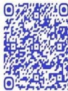
QR code récit de vie

Ces images parlent d'elles-mêmes, surtout cette carcasse, de comment les conditions de vie peuvent être désastreuses dans un groupe armé. Mais, malgré cela, toutes les femmes dans le documentaire de Lamorré et Tosarelli ont exprimé le souhait de continuer la lutte armée, ou dans le métier des armes : « Je ne veux pas redevenir civile, je veux rester combattant, j'ai passé des années dans la forêt, ça ne m'a rien apporté, aujourd'hui, on nous parle d'intégrer l'armée, je ne veux plus retourner en brousse » 268 .