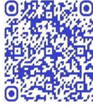
QR code récit de vie