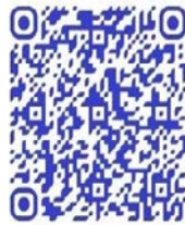
QR code récit de vie

« Mon cœur m'a poussé à rejoindre ceux qui se battent pour le pays, ceux qui luttent pour libérer le pays, la paix doit revenir au pays je ne l'ai jamais connue (...) je viens du groupe Mai-Mai shetani, c'est là où je travaillais, j'ai 22 ans, on était plusieurs combattantes, certaines sont mortes » 176 .