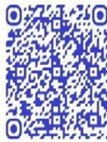
QR code récit de vie

« Je me suis engagée parce qu'il y avait trop de souffrances. Je n'ai pas beaucoup étudié et je n'avais pas de travail avant de rejoindre la milice. Ma famille me conseille, me redonne courage, et me soutient financièrement. Ce sont eux qui s'occupent de mes enfants » 225 .