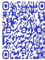
QR code récit de vie

« J'ai vingt ans. Je suis entrée à la milice l'âge de 15 ans. Ça fait longtemps que je n'ai plus peur, j'ai survécu à plusieurs combats. J'ai échappé plusieurs fois à la mort. La mort ne fait plus peur. Je n'y pense même plus. Mon père et ma mère sont morts. Tout ce qu'ils m'ont laissé m'a été ravi. Je ne savais plus comment élever mes deux enfants. C'est alors que j'ai décidé de devenir soldat, au moins si je meurs l'Etat s'occupera de mes enfants » 203 .