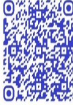
QR code. Séquence vidéo de l'intégration des PMF 183

D'autres femmes combattantes, cette fois dans les FARDC, qui apparaissent dans le documentaire de Lamorré et Tosarelli, font partie d'un commando spécial, l'unité de réaction rapide (URR) :