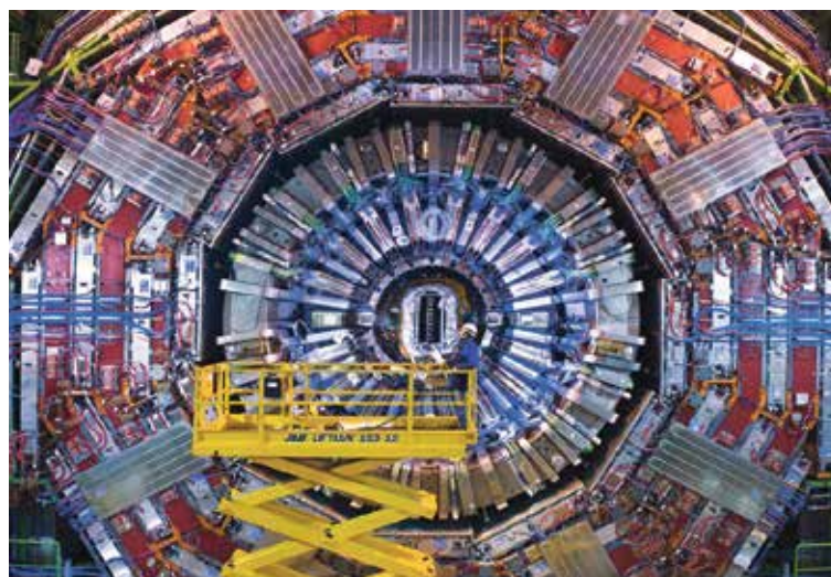
Un détecteur du Grand collisionneur de hadrons (LHC).

Pour ce travail, le livre a été divisé en chapitres qui ont été traduits par onze étudiantes et étudiants de la