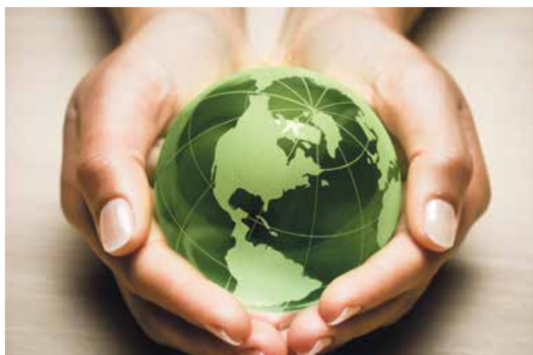
Vers un changement durable pour notre planète?

Par ailleurs, si l'intérêt professionnel de la formation est établi, son influence sur les comportements