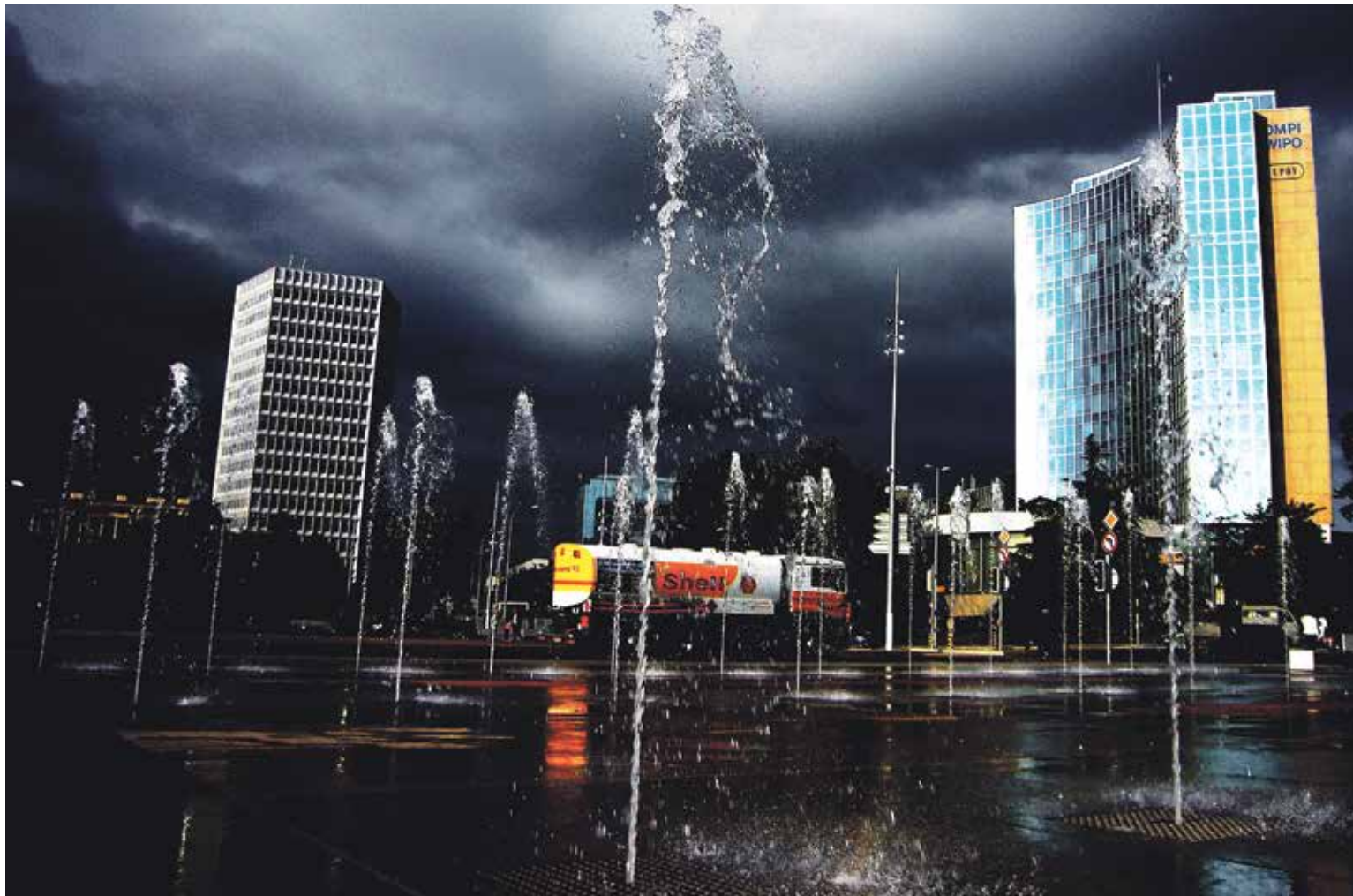
Le secteur des multinationales étrangères à Genève génère 928 millions d'impôts sur le revenu.