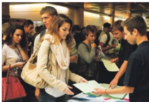
Journée d'accueil des étudiants.

Le conseil est composé de 15 sièges. Six sont réservés aux représentantes et représentants des associations étudiantes, sept aux étudiants, deux