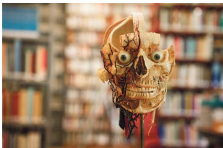
Modèle anatomique de la Faculté de médecine.