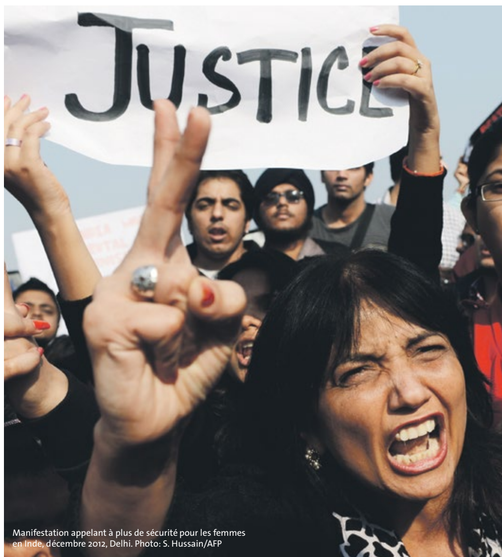
Manifestation appelant à plus de sécurité pour les femmes en Inde, décembre 2012, Delhi.

Promus comme vecteurs d'émancipation des femmes, les droits humains ne seraient-ils pas en train de se retourner contre elles? Ratna Kapur, professeure de droit à Delhi, en Inde, apportera son éclairage lors d'une conférence le jeudi 12 mai