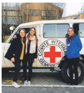
Étudiantes de l'UNIGE participant au concours Jean Pictet.

Début avril, la représentation étudiante genevoise à Vienne a réalisé la meilleure performance de son histoire au «Vienna Moot Court», un concours en arbitrage commercial international auquel participaient plus de 300 équipes venues du monde entier. Les étudiants de l'UNIGE ont en effet obtenu une deuxième place pour l'un des mémoires et deux mentions honorables. Enfin, les Genevois