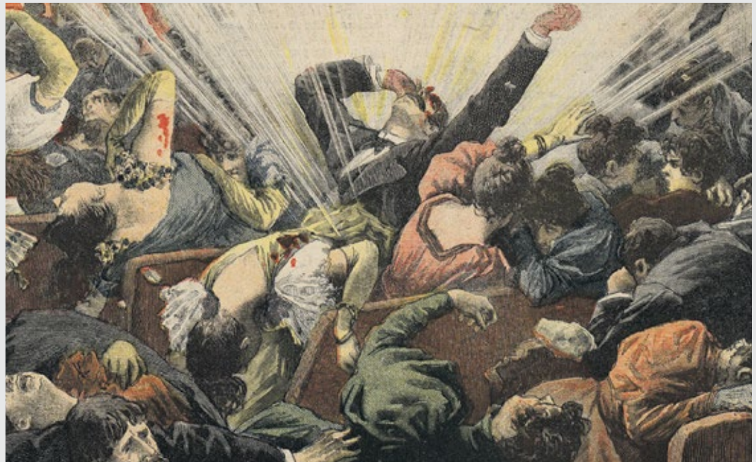
Attentat au Liceu, Barcelone, «Le Petit Journal», 1893.

| MAISON DE L'HISTOIRE – GSI | TABLE RONDE 18h30 • Un terrorisme global? Acteurs, idéologies