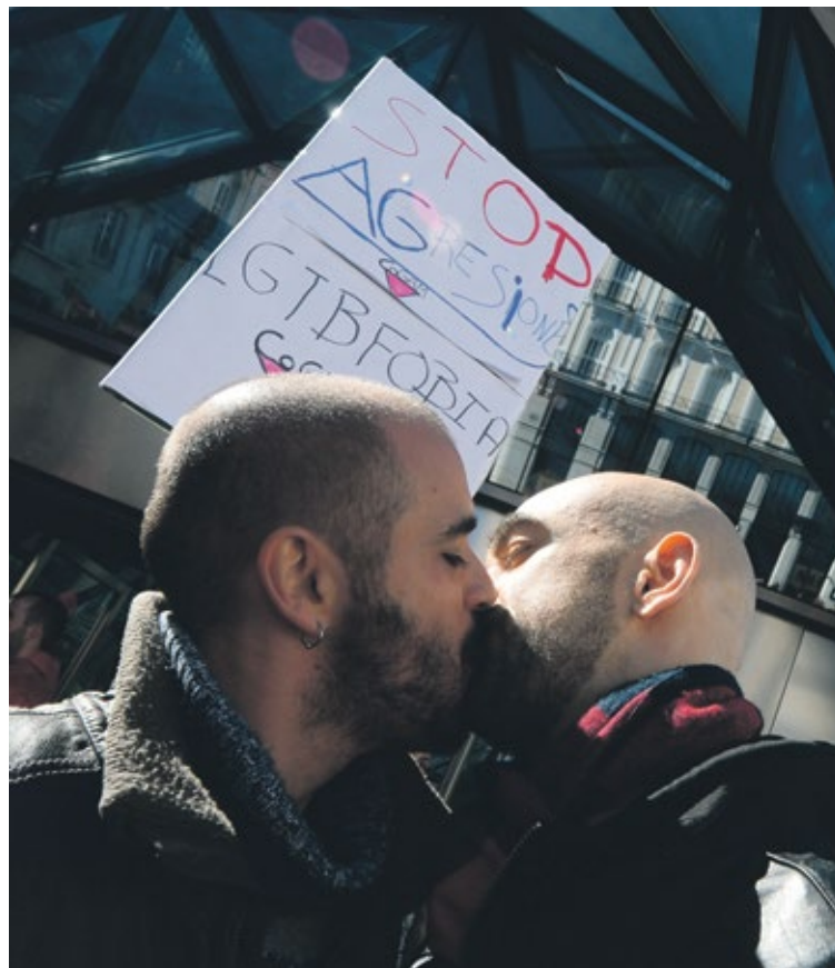
Manifestation contre l'homophobie à Madrid en Espagne en 2015.

L'excitation physiologique n'est pas une mesure parfaite de l'intérêt sexuel mâle. Elle peut aussi être interprétée comme un signe de peur ou d'anxiété. D'autres études ont tenté des approches alternatives, certaines ne se basant pas sur des mesures génitales mais sur des temps de regards et des tâches spécifiques. Mais les résultats ont commencé à devenir contradictoires. On en est arrivé à une situation d'affrontement entre deux écoles: celle qui assimile les homophobes à des homosexuels refoulés et celle qui prétend que l'homophobie est le produit d'une véritable aversion ou répulsion vis-à-vis de l'homosexualité... Notre méthode permet en quelque sorte de réconcilier les deux.