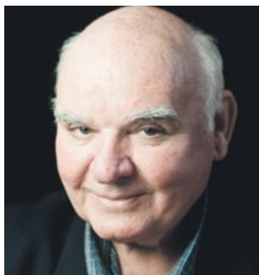
Michel Pastoreau

S pécialiste de l'héraldique et de la symbolique, Michel Pastoreau appartient au cénacle fermé des historiens connus du grand public grâce à deux sujets d'étude privilégiés: les animaux et les couleurs. Prix Médicis 2010 avec son ouvrage Les Couleurs de nos souvenirs , il a précédemment tenu le journal chromatique du bleu, du noir et du vert, et s'apprête à livrer le parcours de la couleur rouge dans un prochain ouvrage à paraître cet automne. La conférence qu'il a tenue le 14 avril dernier à Uni Dufour en donne les grandes lignes.