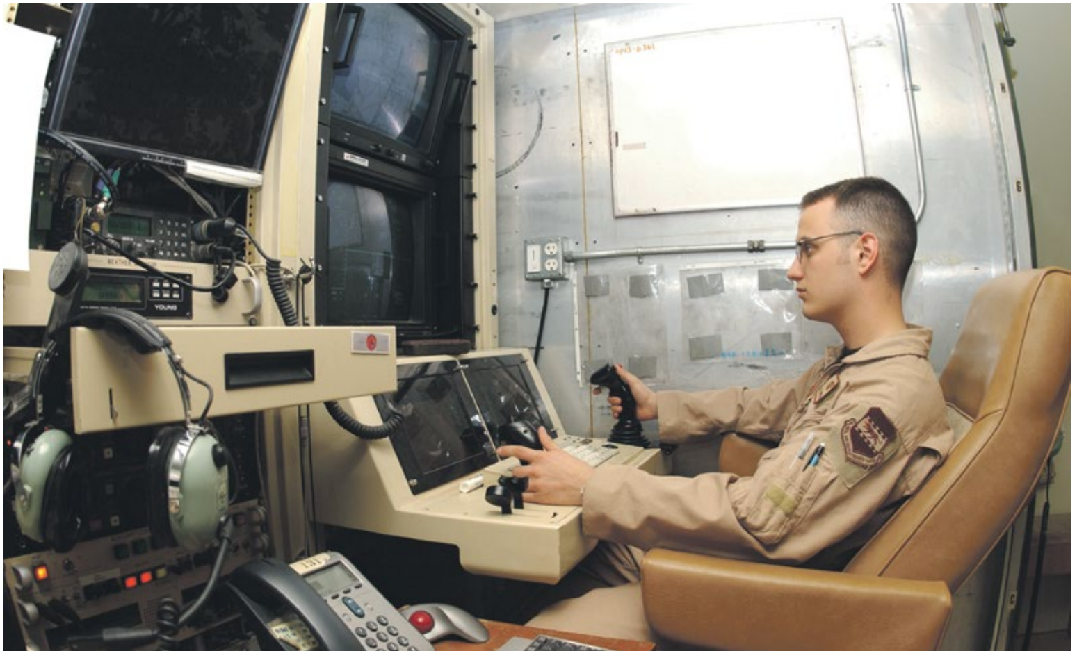
Un opérateur de drones dans sa station de contrôle en Irak, en 2006.