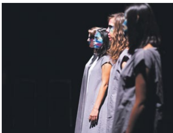
Antigonick d'Anne Carson, jouée par la Cie Emmet (théâtre anglais), mai 2015.

L'intérêt d'un tel festival est multiple. Il a d'abord l'avantage de mettre au cœur de la cité la pratique théâtrale universitaire, qui