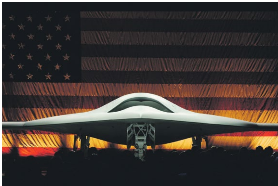
Le modèle de drone Phantom Ray, destiné à l'armée américaine.